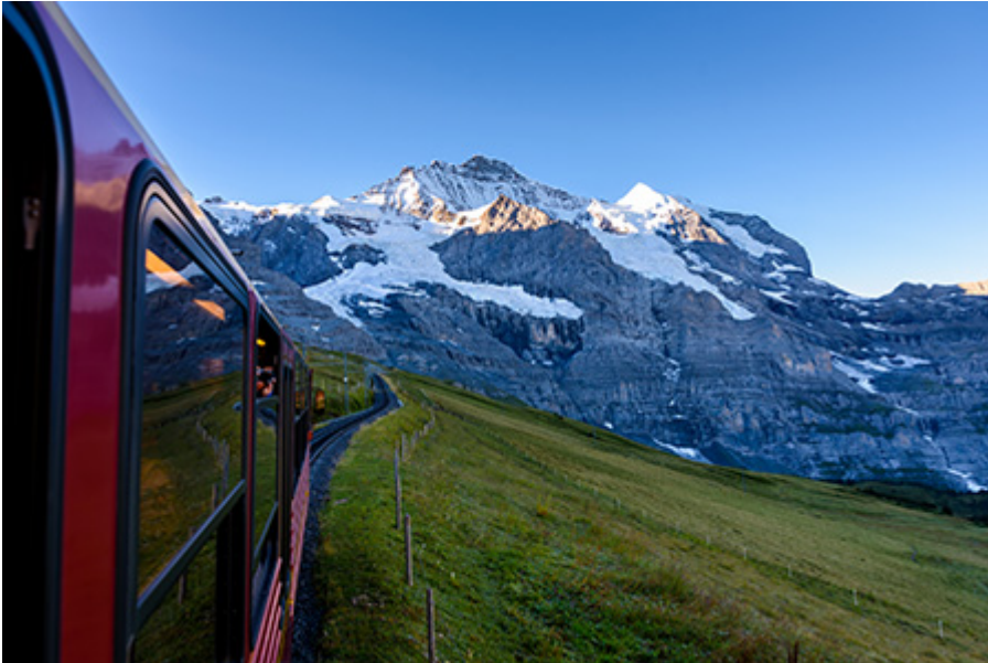
Jungfrau - Lauterbrunnenből 215 CHF