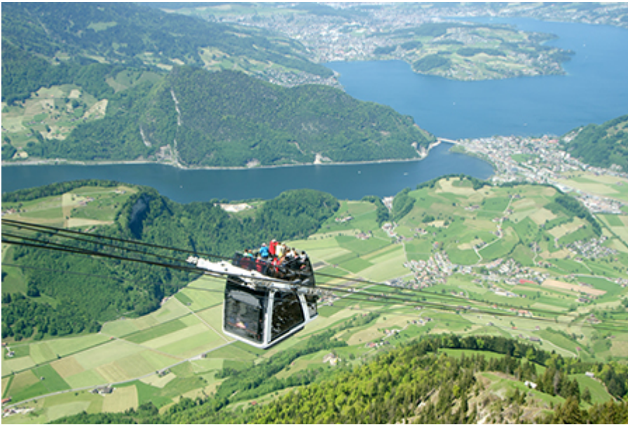
Stanserhorn - nosztalgia síkló, Cabrio felvonó 82 CHF