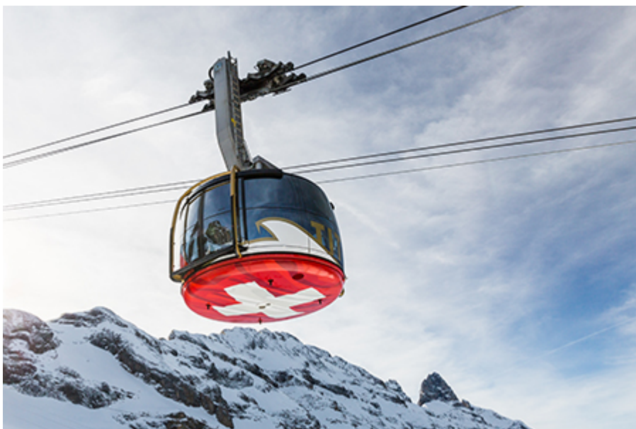
Engelberg - felvonó, Rotair függővasút 82 CHF