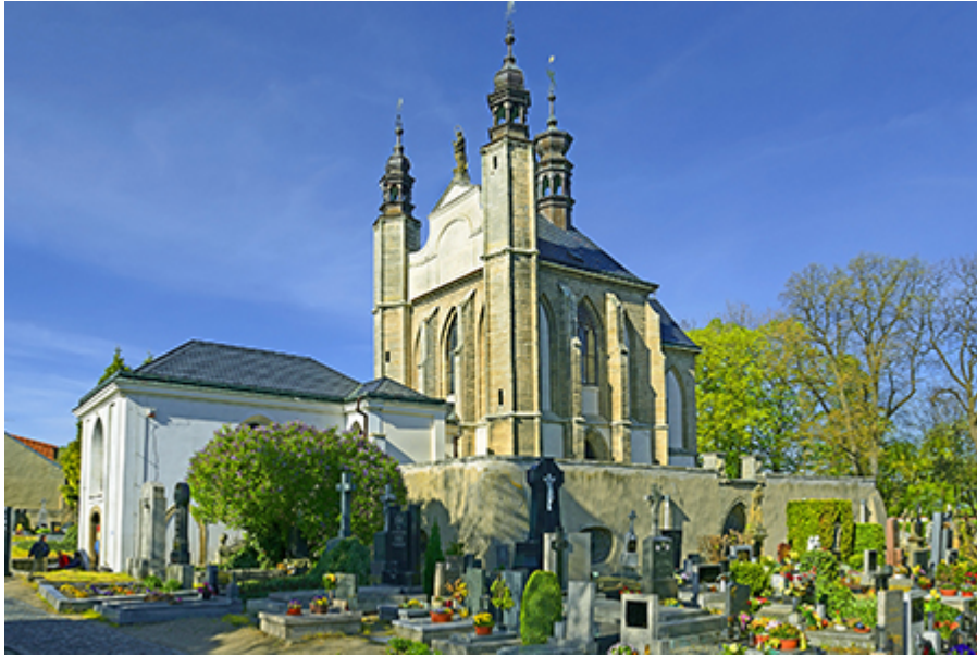
Kutna Hora - Csontkápolna 220 CZK