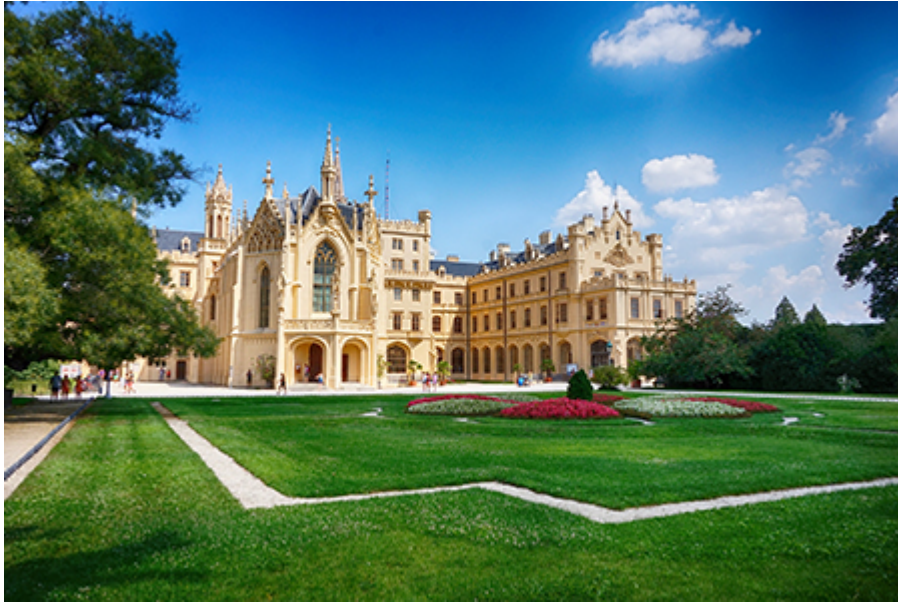
Lednicei kastély 300 CZK