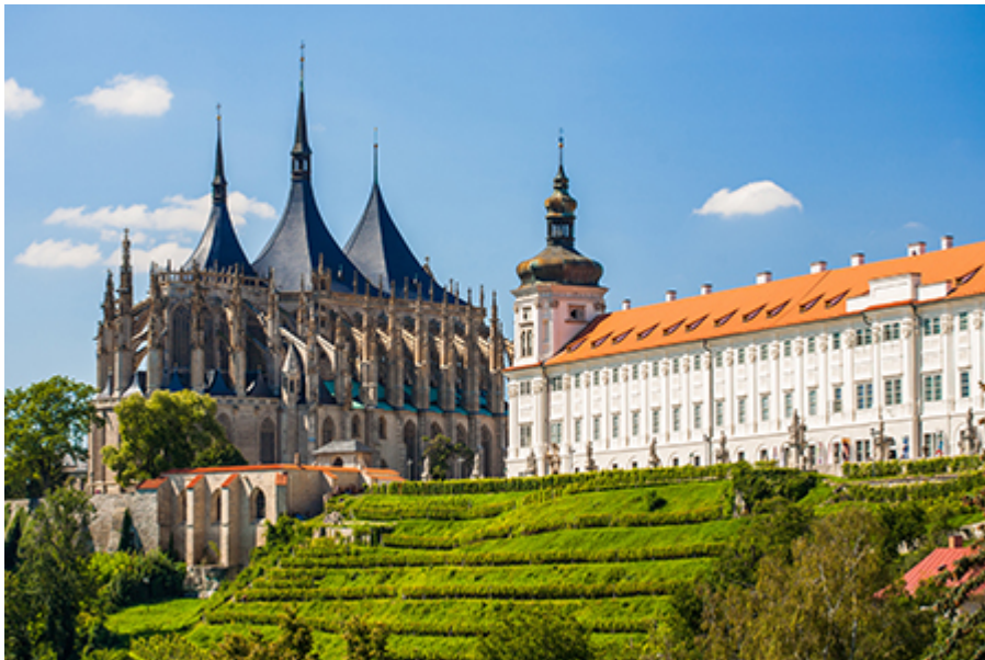
Kutna Hora - Szt. Borbála 180 CZK