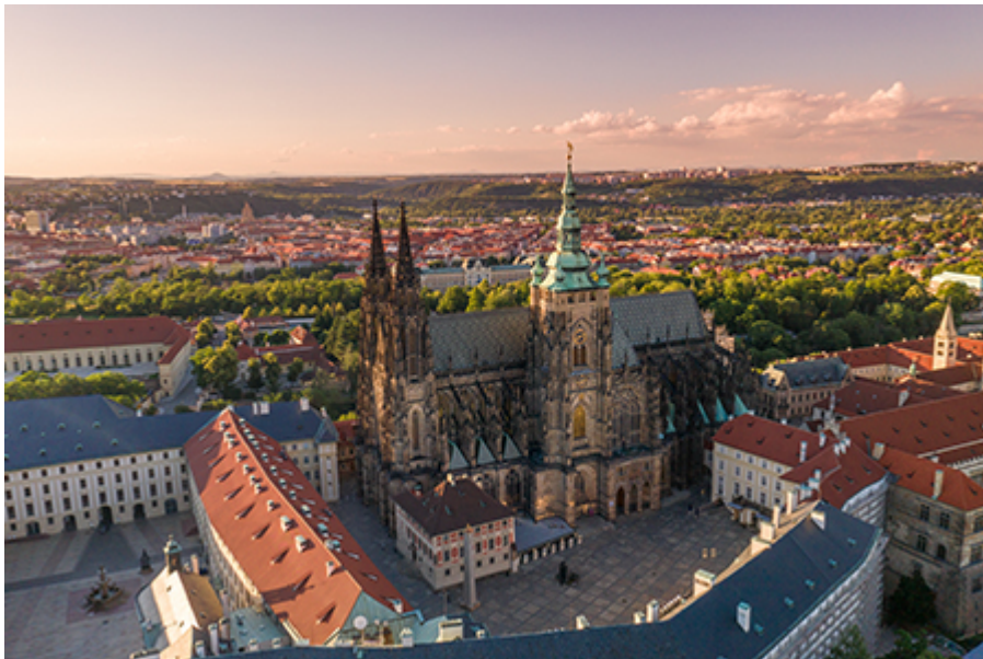
Prága - Vár (Katedrális, Királyi palota, Arany utcácska) 450 CZK