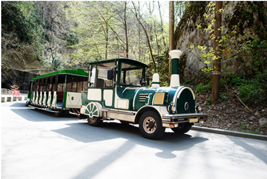
kisvonat a barlangnál Lanovkával 260 CZK