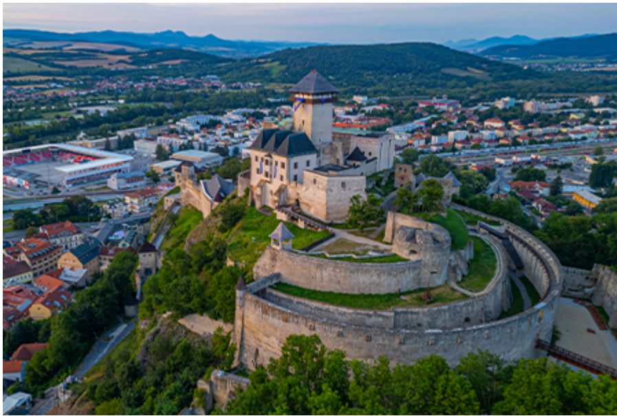
Trencsényi vár 9 €