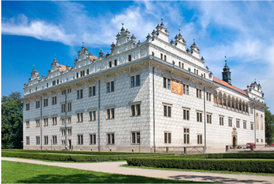
Litomyšl kastély 220 CZK