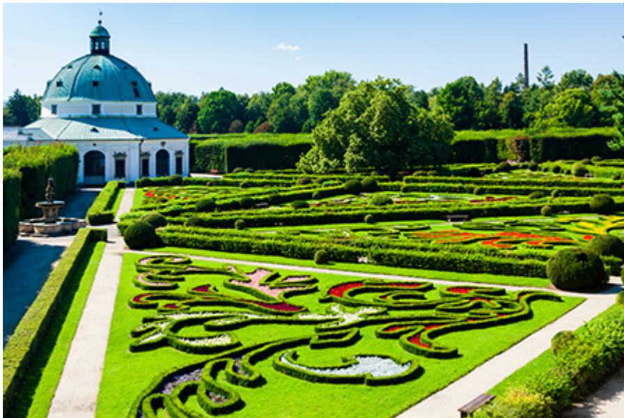
Kromeriz virágoskert 180 CZK