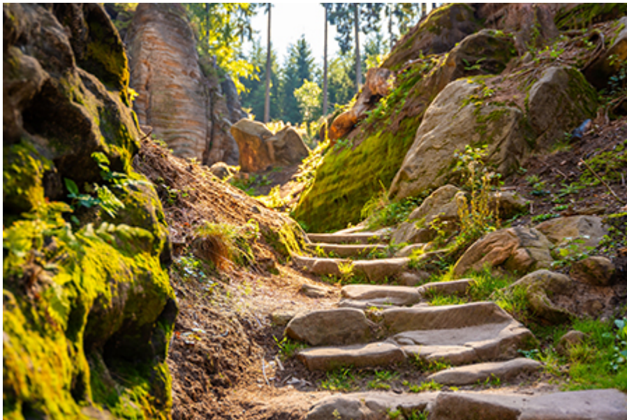
Prachovi sziklák 150 CZK