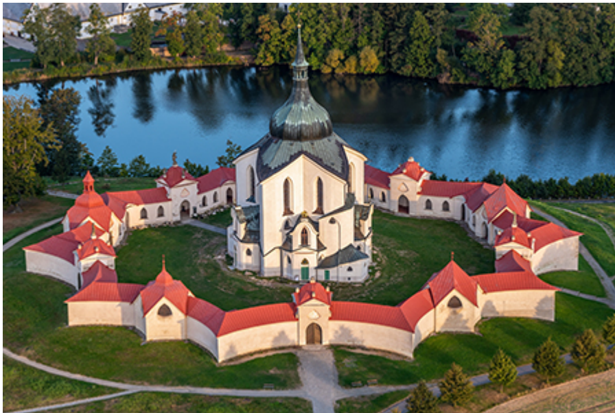
Nepomuki Szent János Zarándoktemplom 150 CZK