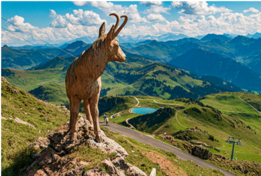
Kitzbüheler Horn 31 €