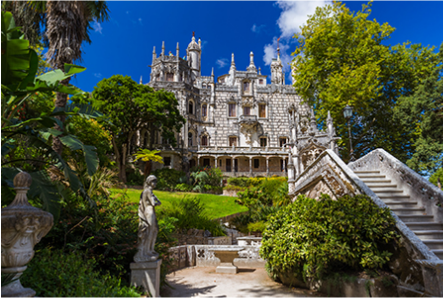
Sintra - Regaleira Palota 15 €