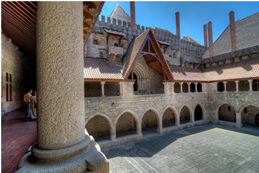
Braganza palota 5 €