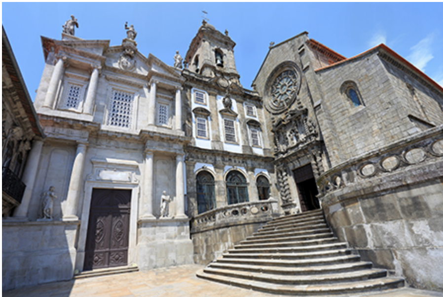
Porto - Szent Ferenc Templom 11 €