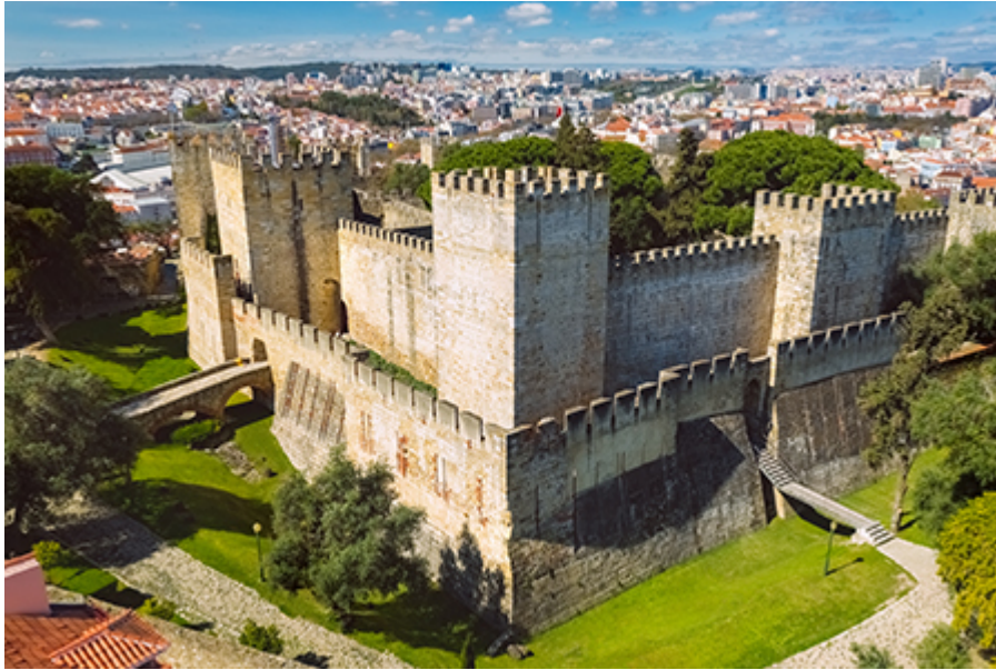
Lisszabon - Szent György vár 15 €