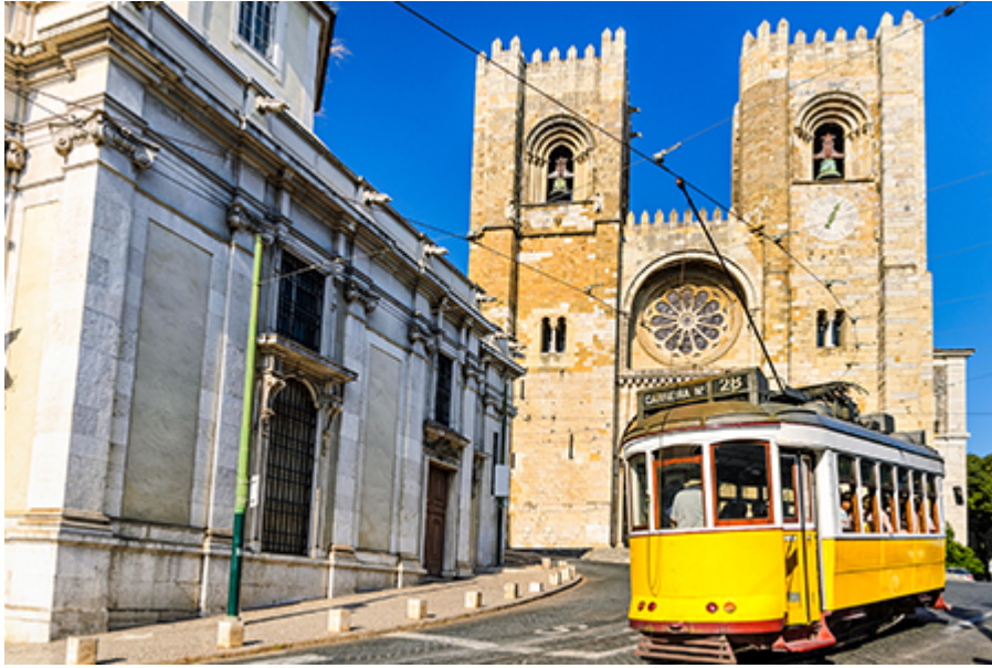
Lisszabon - Sé katedrális 7 €