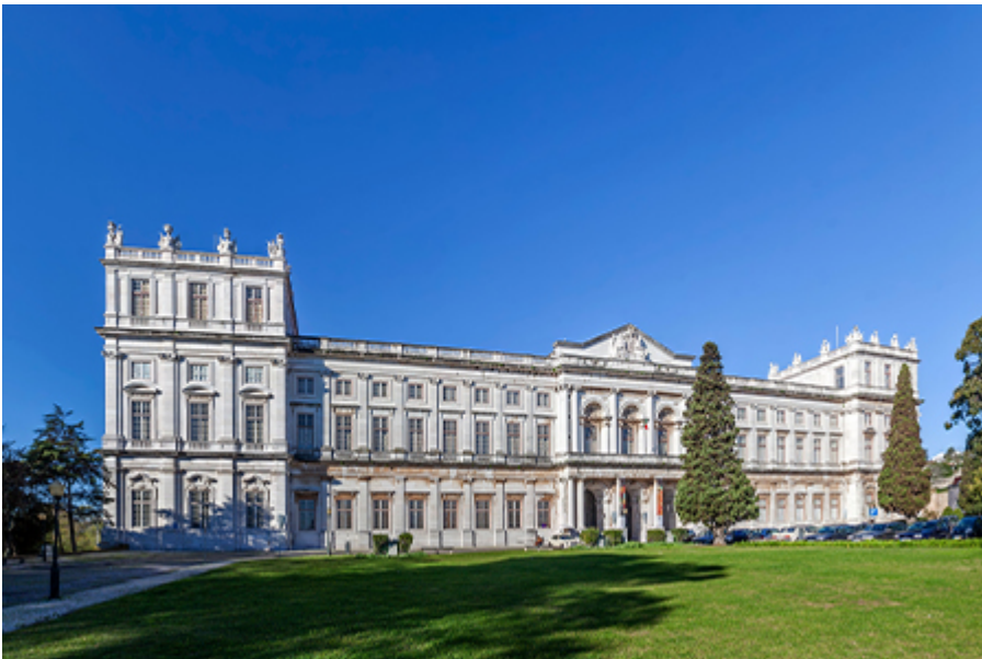
Lisszabon - Királyi palota 15 €