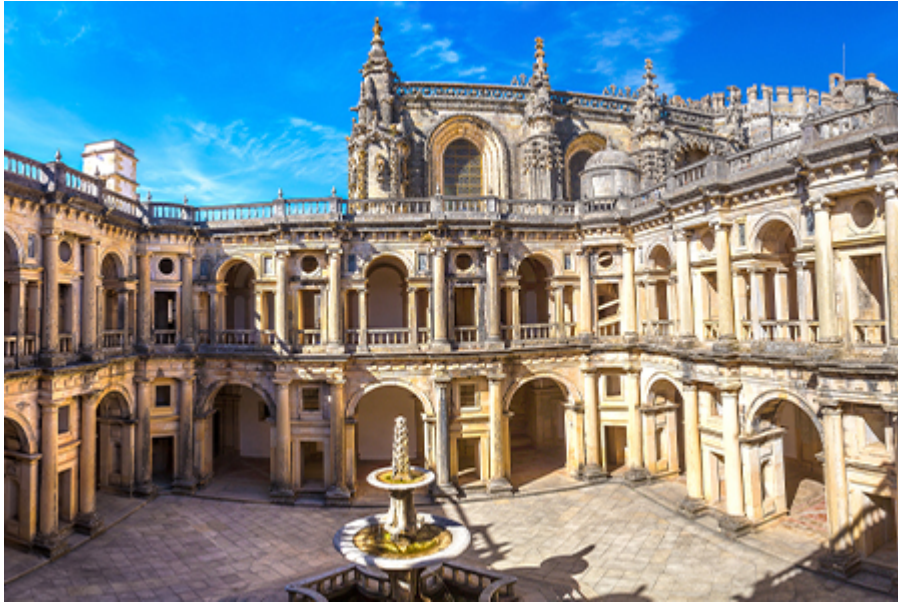
Tomar - Templomos Lovagrendek várkastély 15 €