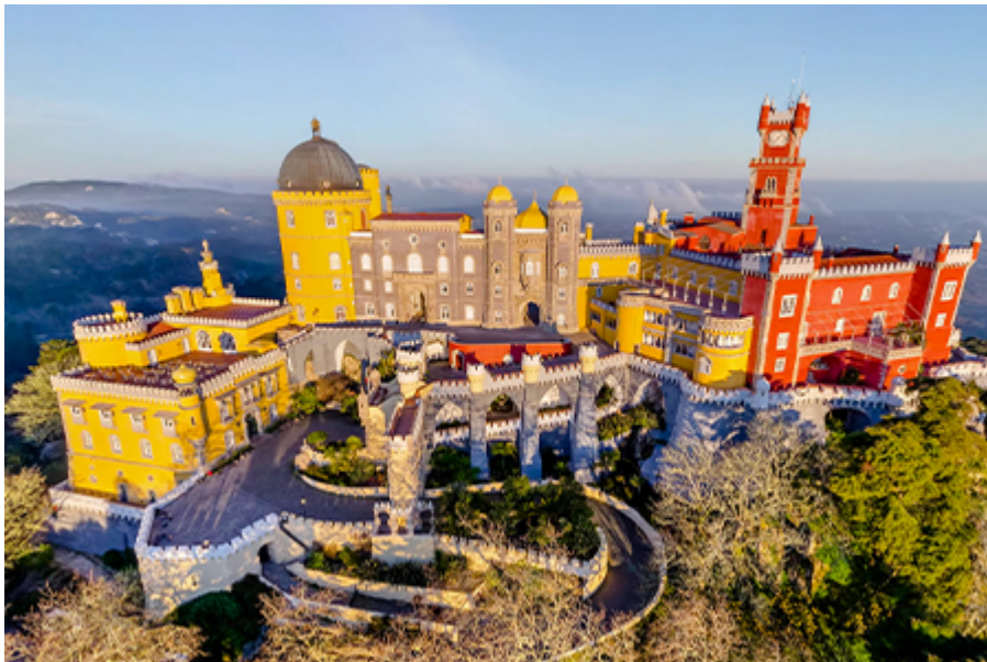
Sintra - Királyi Palota 15 €