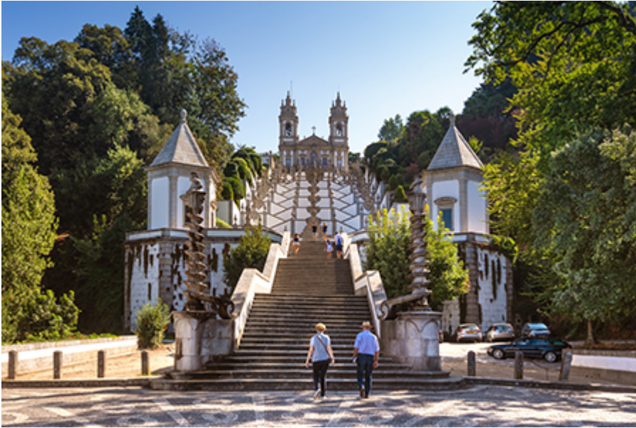
Braga - Sé katedrális 7 €