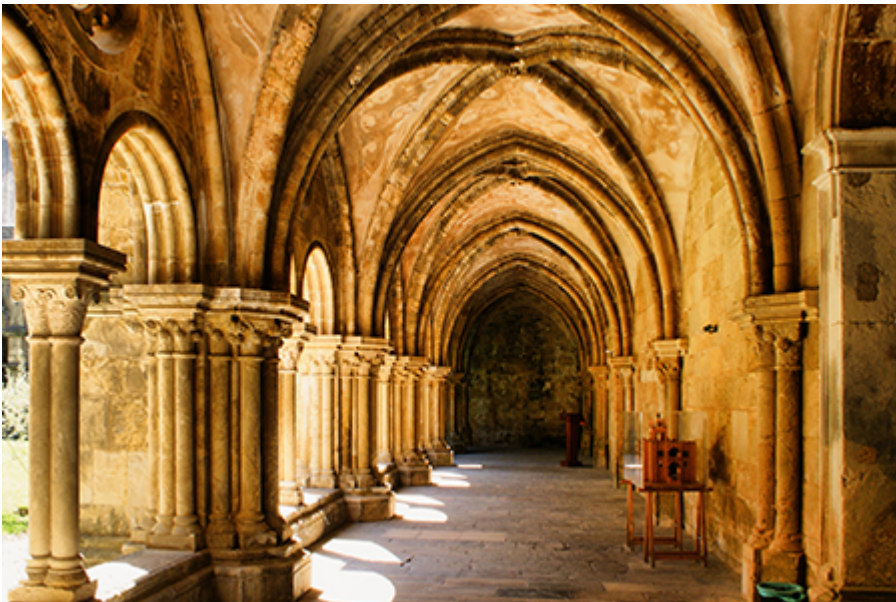
Coimbra - Sé Velha 2,5 €