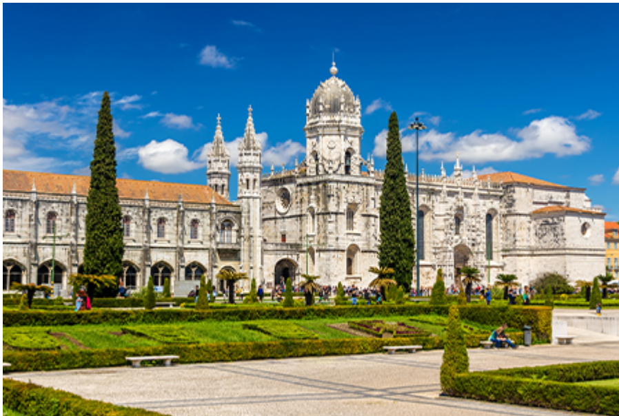
Lisszabon - Jeromos templom 18 €