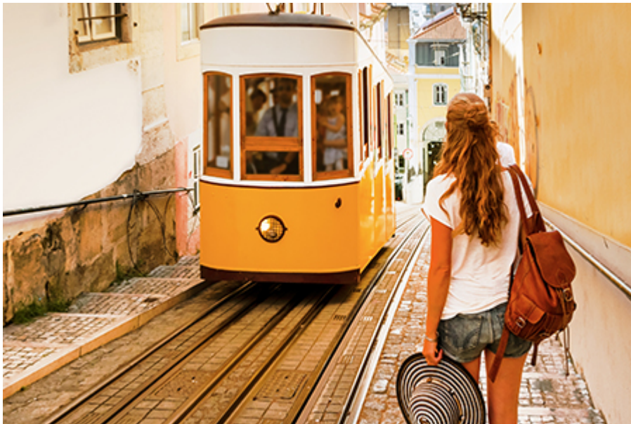
Lisszabon - Villamos 4 €