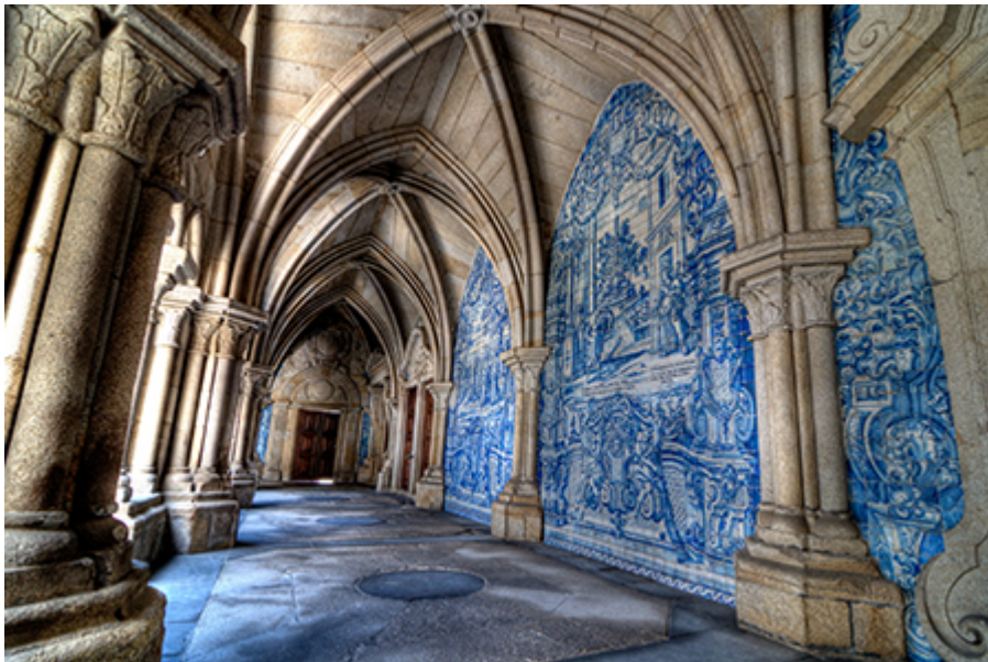
Porto - Sé katedrális 2 €