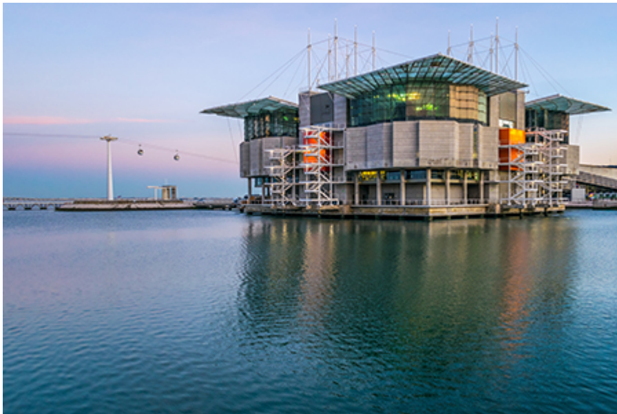
Lisszabon - Óceánográfiai múzeum 25 €