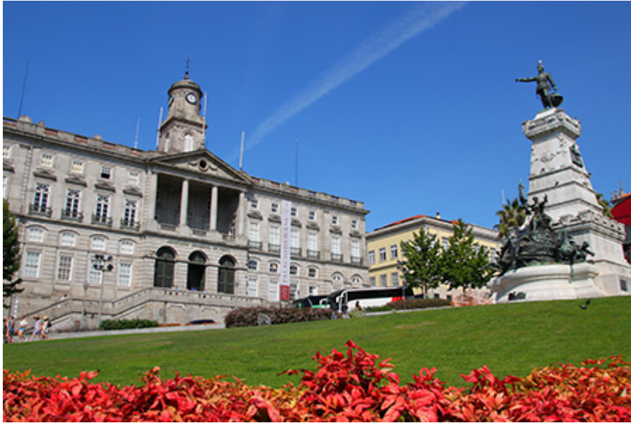
Porto - Tőzsdepalota 16 €