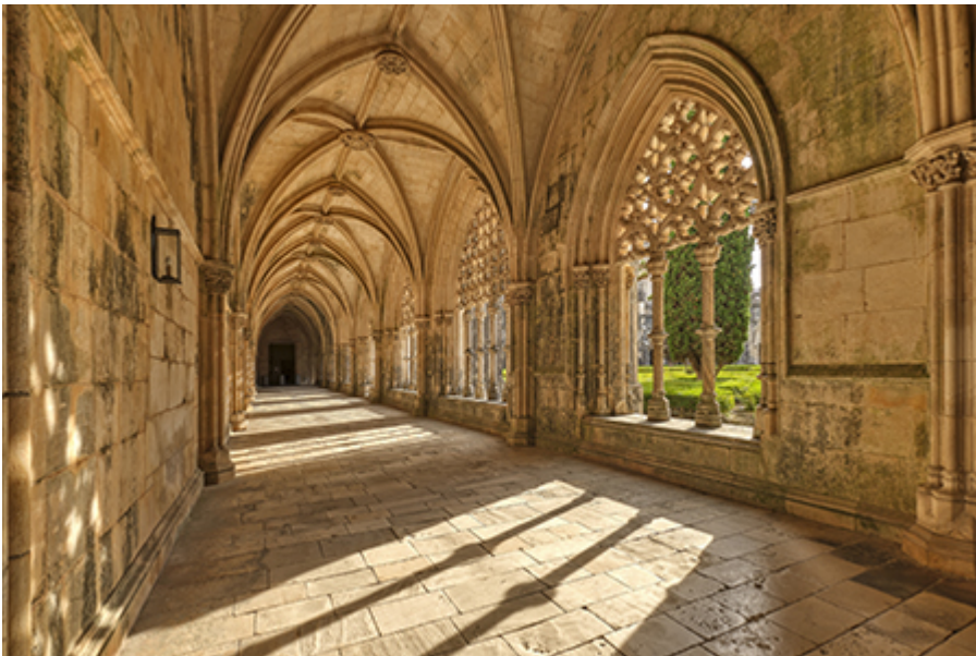
Batalha - templom 15 €