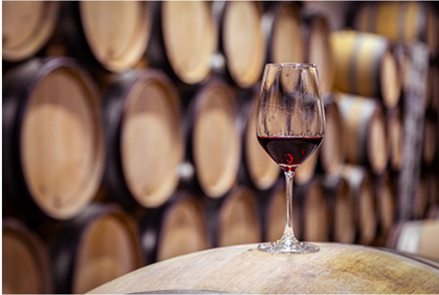
Porto - Borház 20 €