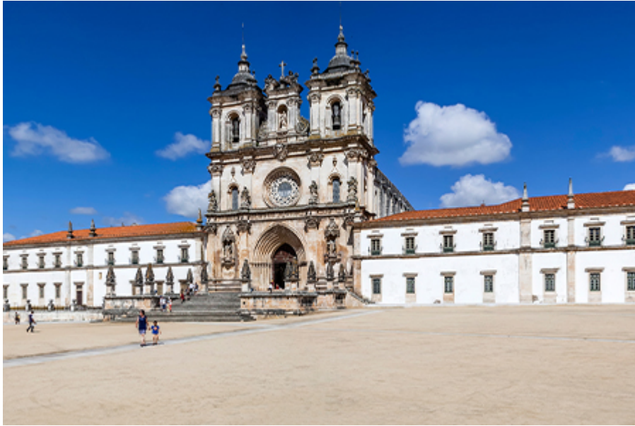
Alcobaca - Szűz Mária Apátság 11 €