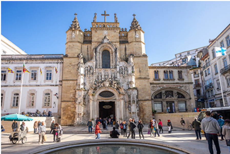
Coimbra- Szent Kereszt templom 4 €