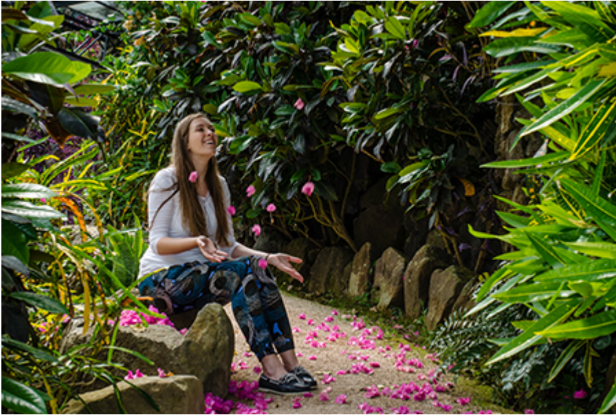
Lisszabon - Botanikus kert 4 €