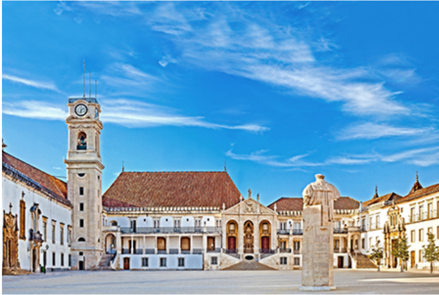
Coimbra - Egyetem 17 €