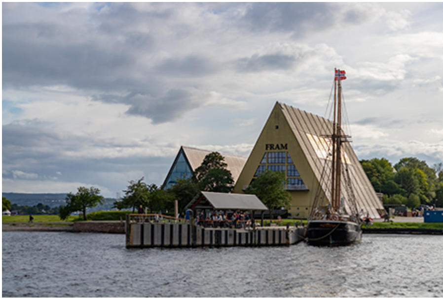
Oslo - Fram múzeum 13 €