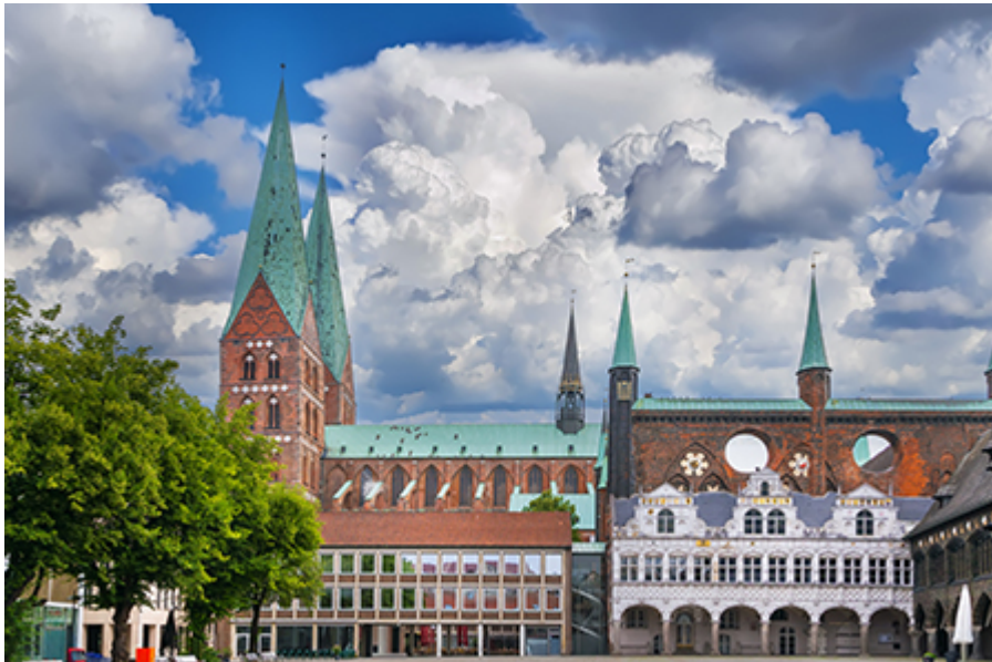
Lübeck - Mária-templom 4 €