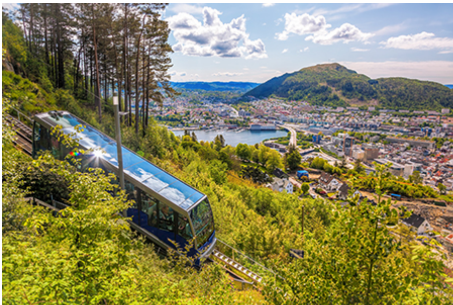
Bergen-i felvonó 17 €