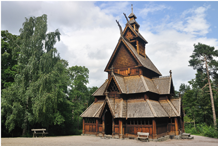
Oslo - Skanzen 17 €