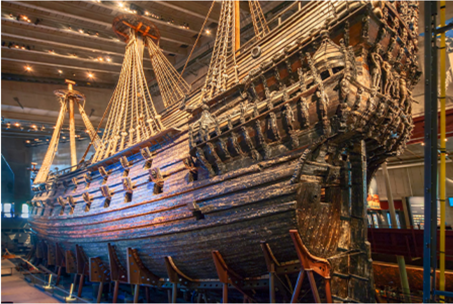
Stockholm - Vasa Múzeum 22 €