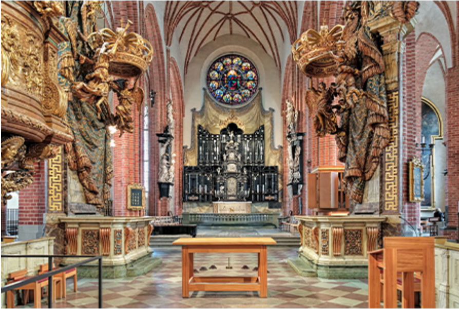
Stockholm - Nagytemplom 11 €