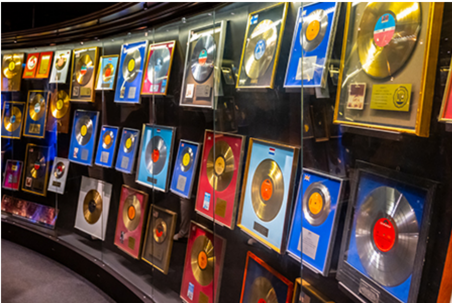
Stockholm - ABBA Múzeum 32 €