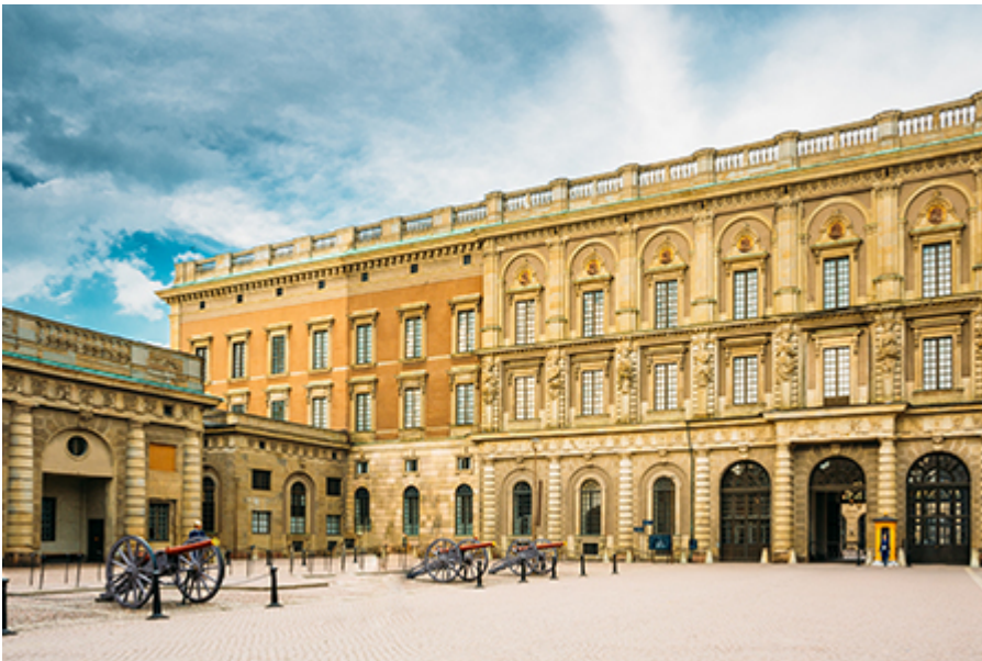
Stockholm - Királyi Palota 21 €