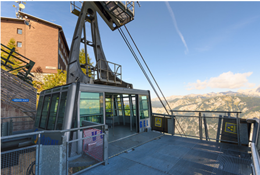
Vogel-felvonó 30 €