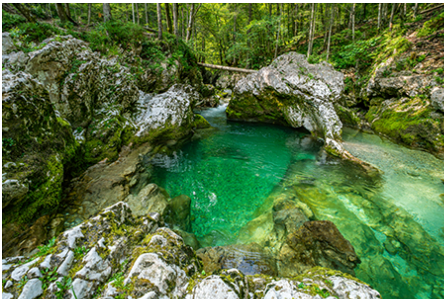
Mostnica-szurdok 4 €