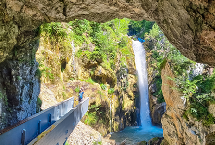
Tscheppaschlucht 10,5 €