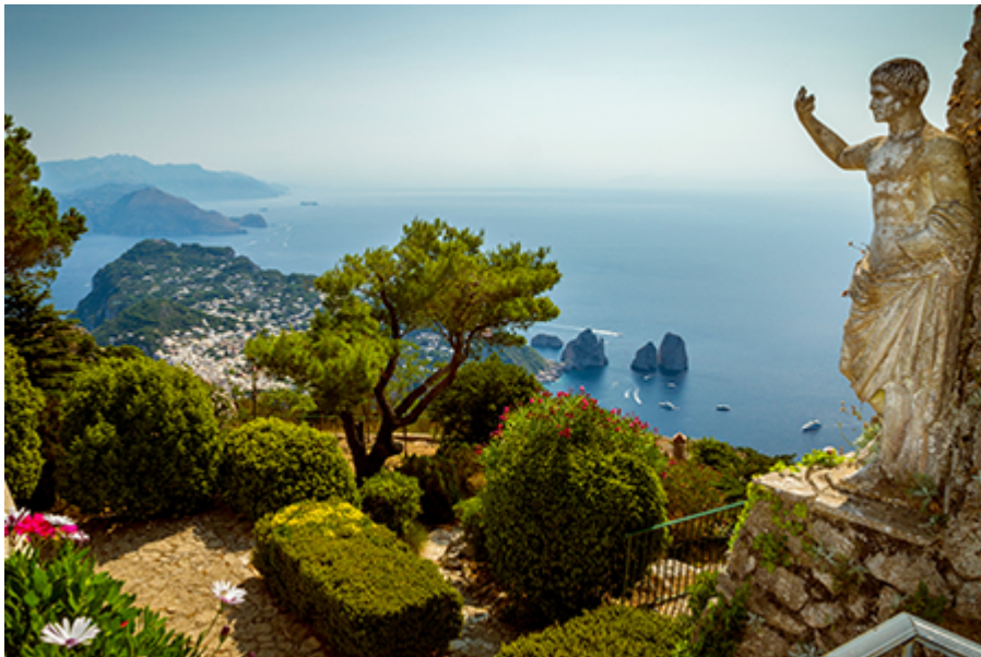
Capri - Augustus kert 3 €