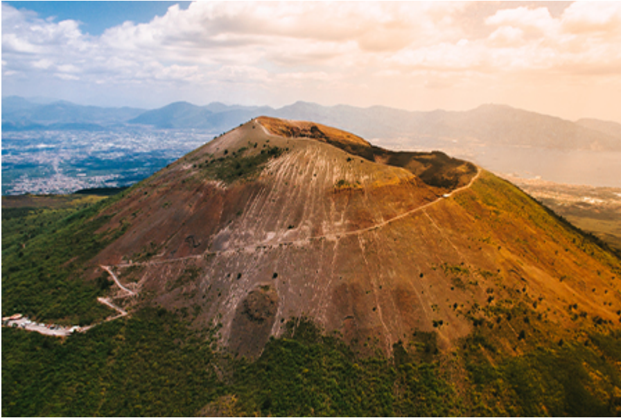
Vezúv 28 €