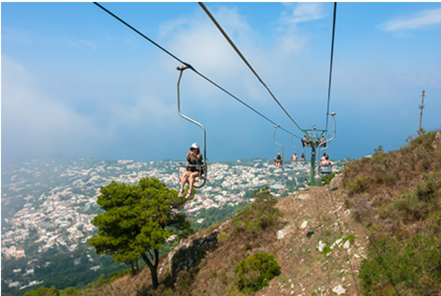
Monte Solaro felvonó 14 €