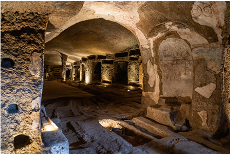
Nápoly - San Gennaro katakombák 13 €