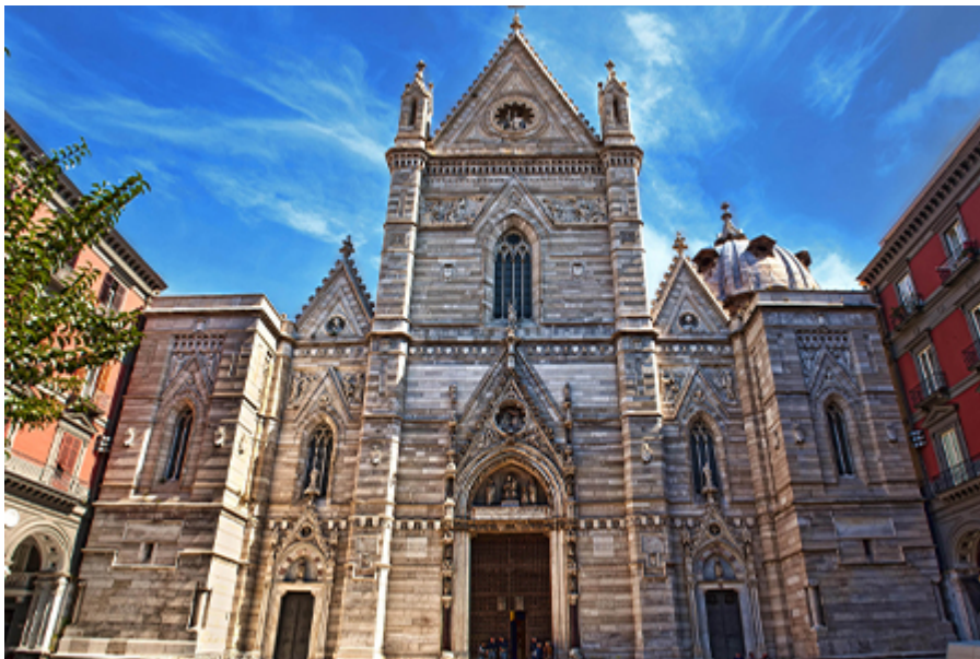
Nápoly - Dóm Keresztelőkápolna 2 €