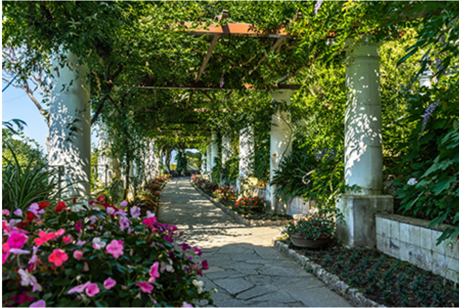
Anacapri - Axel Munthe villa 12 €