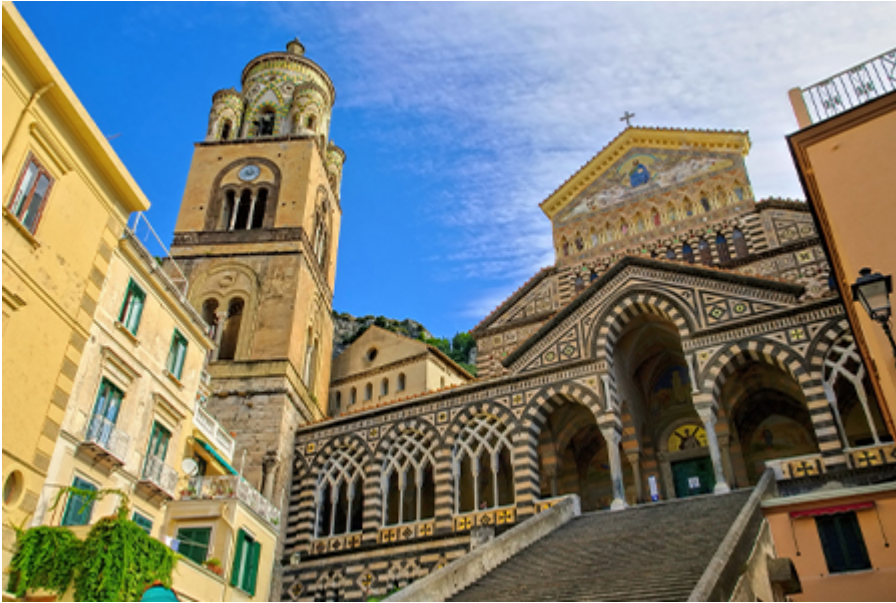
Amalfi - Dóm 4 €