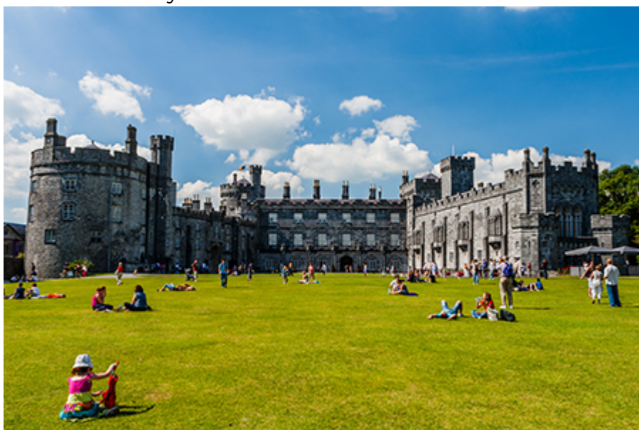
Kilkenny Castle 8 €