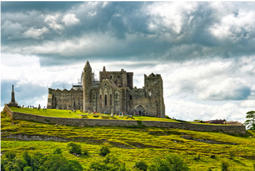
Rock of Cashel 8 €