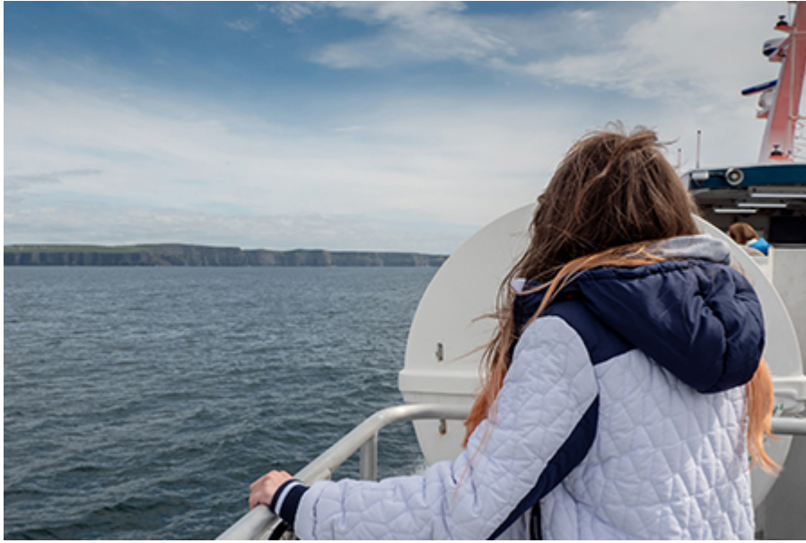
Moher hajózás 30 €