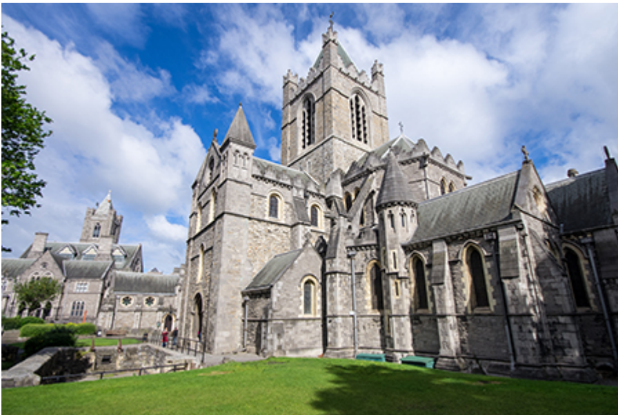
Dublin - Krisztus katedrális 12 €