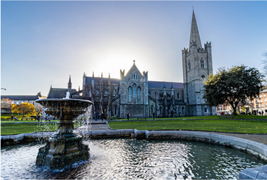
Dublin - Szent Patrik-székesegyház 12 €