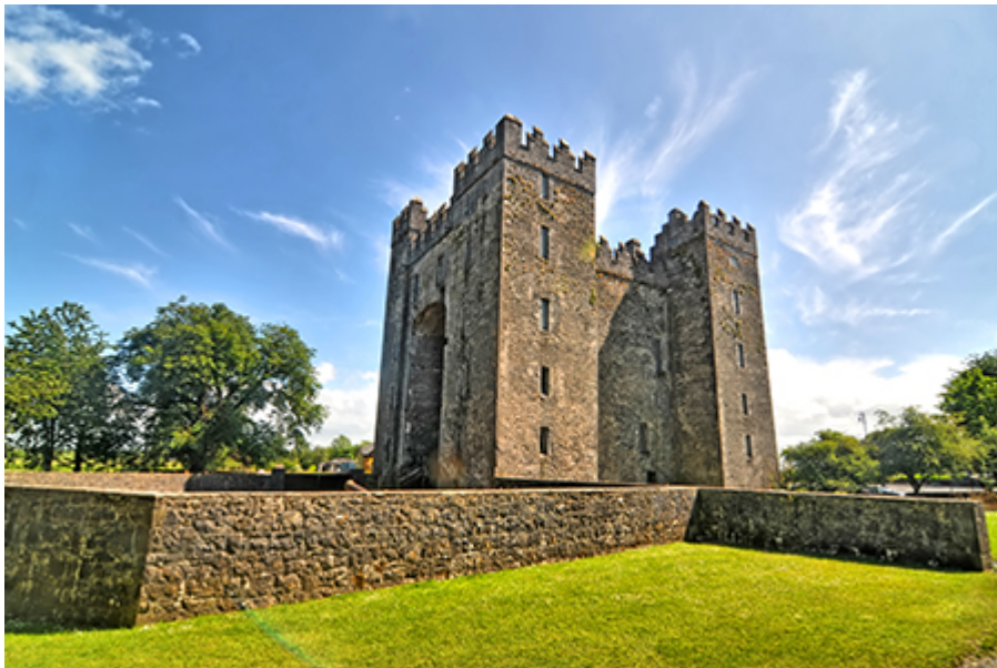
Bunratty Castle és skanzen 20 €