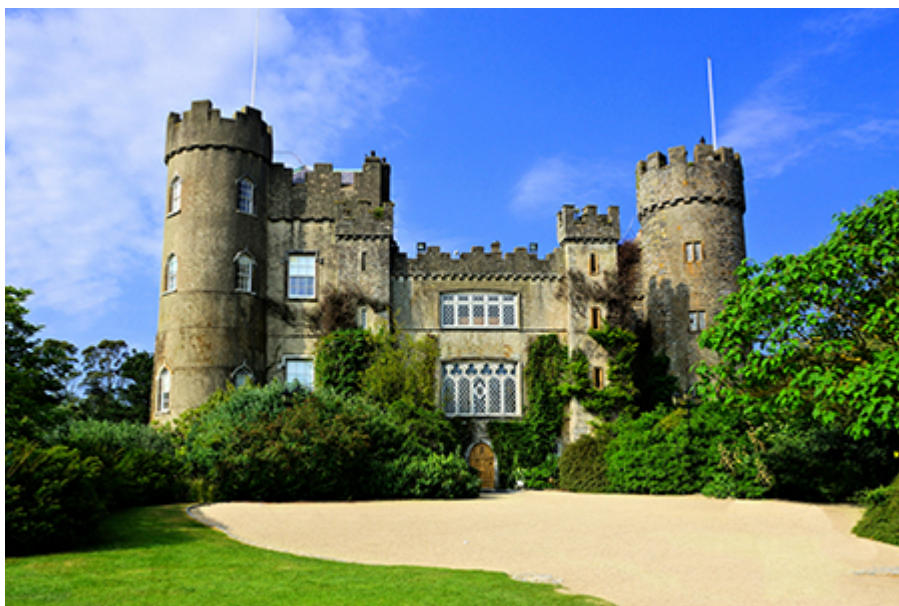
Malahide kastély 18 €