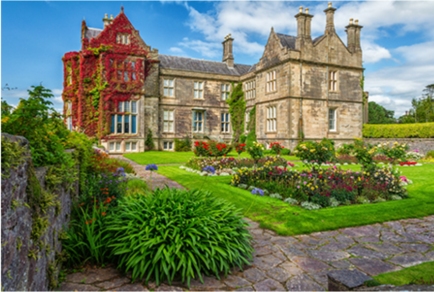
Muckross House 9 €