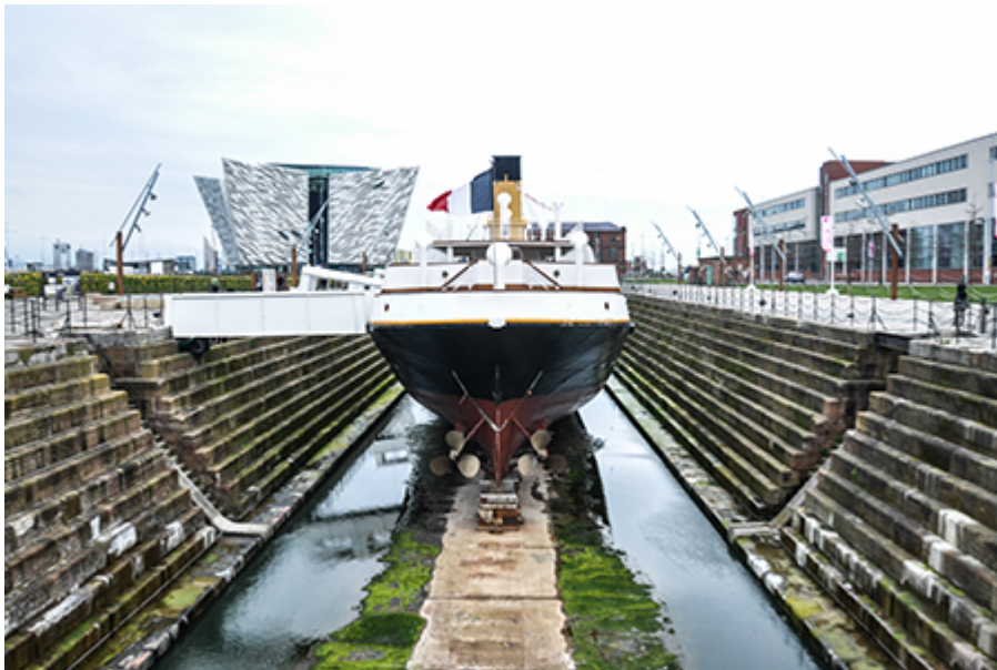
Belfast - Titanic kiállítás 31 €