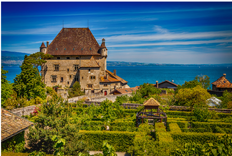
Yvoire - Jardin des cinq sens 15 €