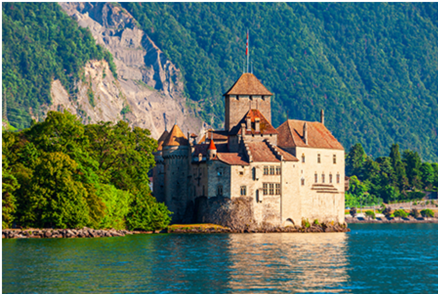
Chillon - vár 12 CHF