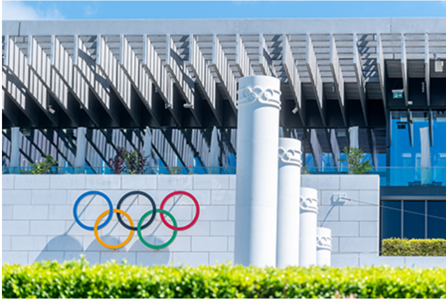
Lausanne - Olimpiai múzeum 20 CHF