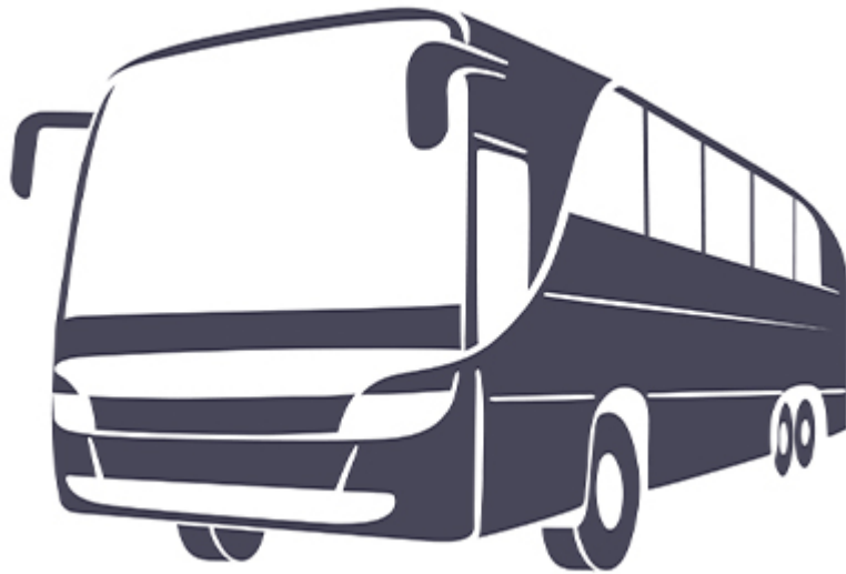
Lausanne - Tömegközlekedés 10 CHF