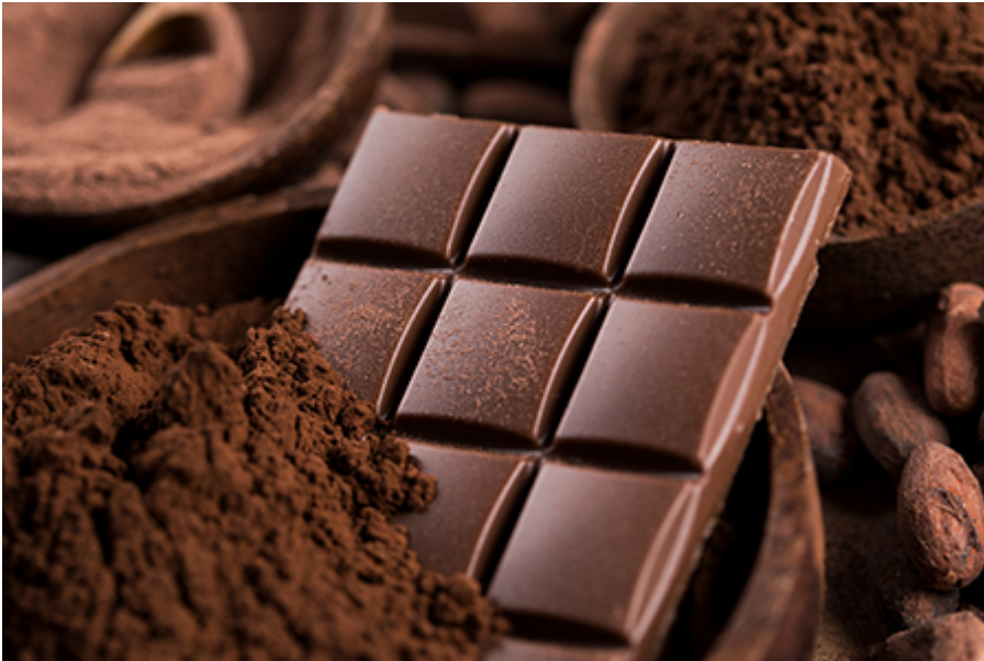
Evian - Nestlé csokoládé gyár 14 CHF