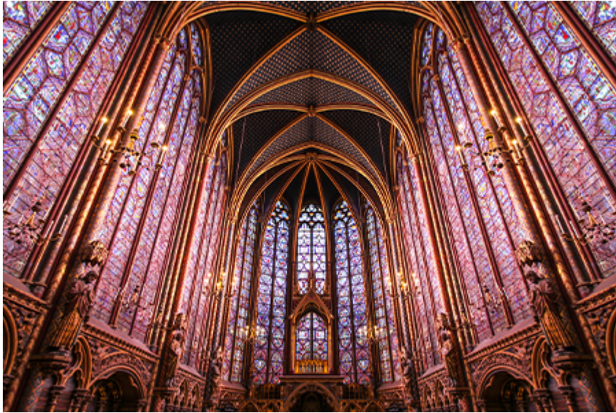
Párizs - St. Chapelle és Concierge 25 €