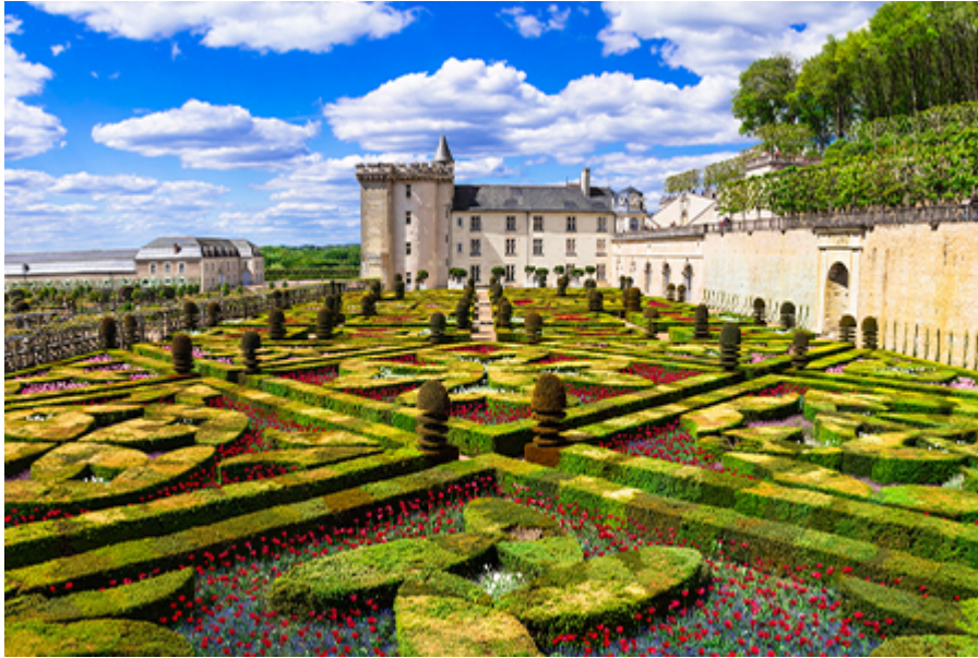
Villandry-kastély park 14 €