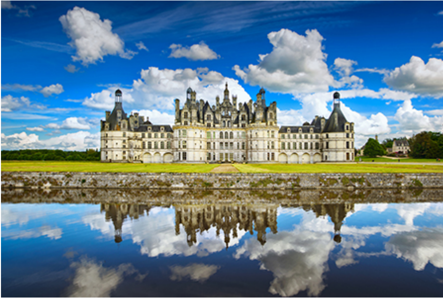
Chambord kastély 15 €