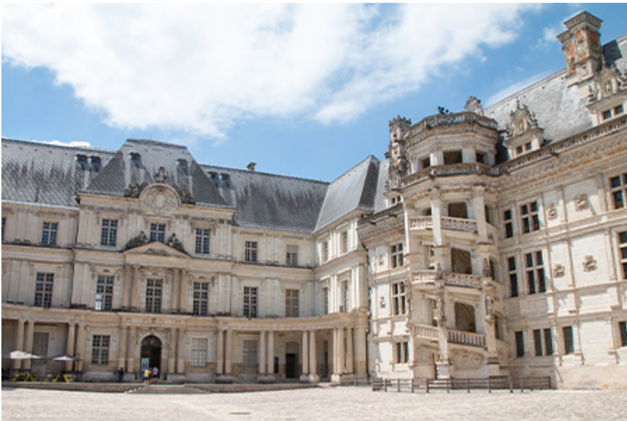
Blois kastély 15 €