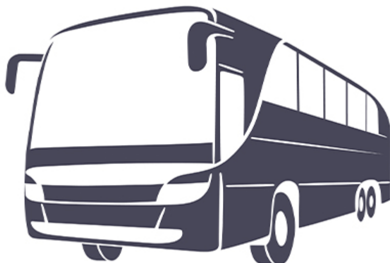
Keukenhof busz (tavasszal) 19 €