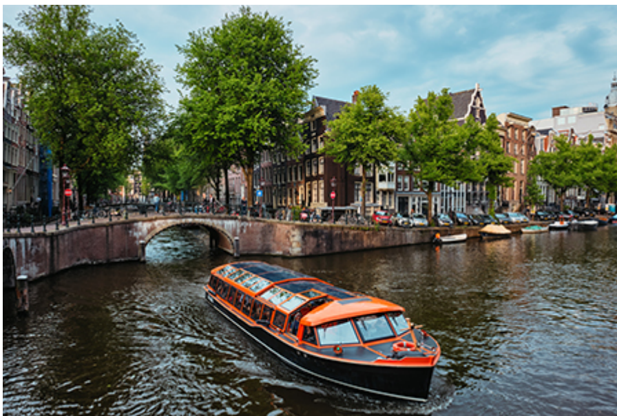
Amszterdami hajózás 20 €