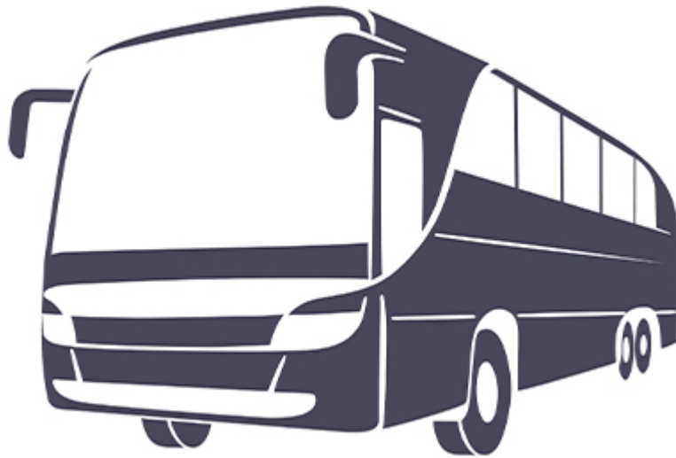
Gouda-Hága - tömegközlekedés (nyáron) 45 €