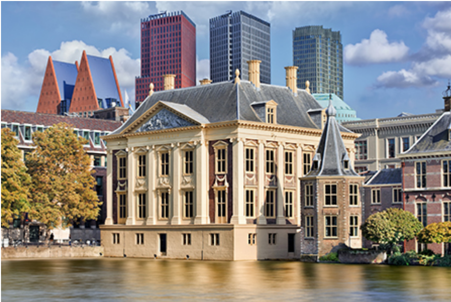
Mauritshuis house (egyéni megtekintéssel nyáron) 24 €