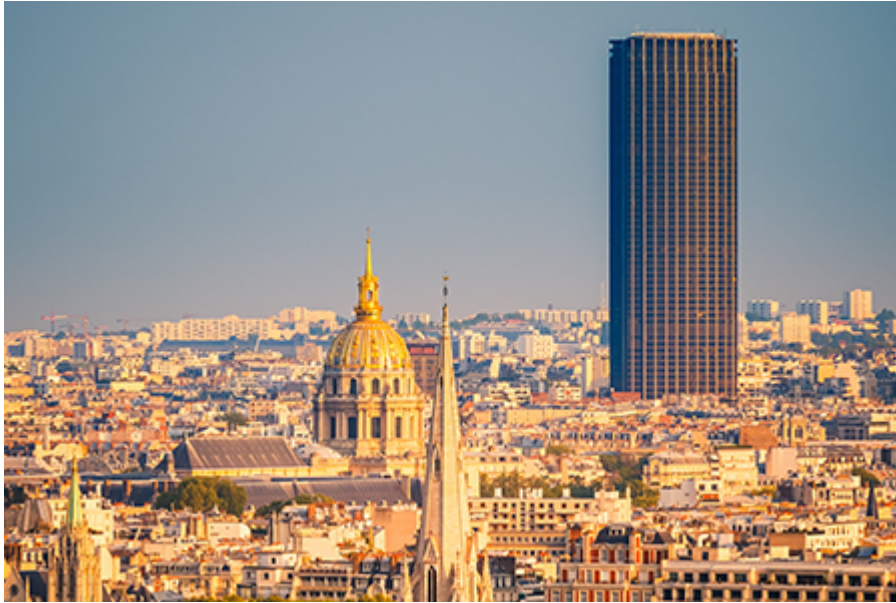
Montparnasse torony 23 €