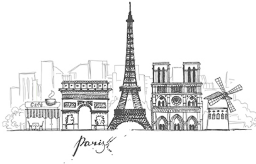
Párizs - Múzeum Kártya 105 €