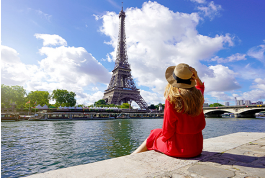
Párizs - Eiffel-torony (II. emelet) 24 €