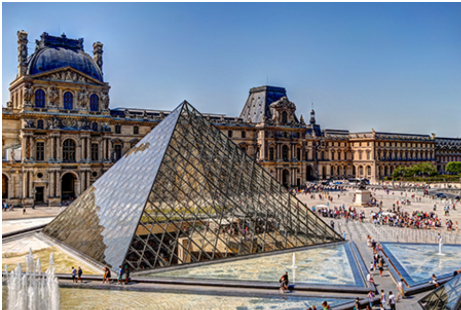
Tárlatvezetés - Louvre 21 €