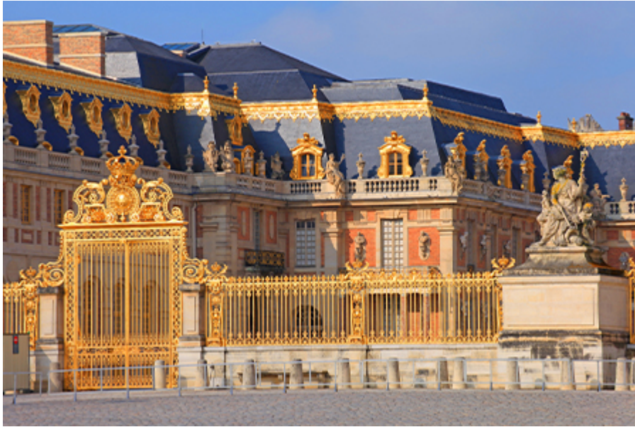
Tárlatvezetés - Versailles 21 €