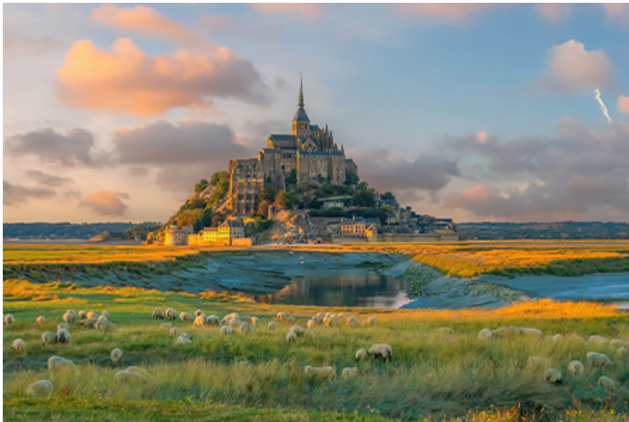
Mont St. Michel - Apátság 12 €