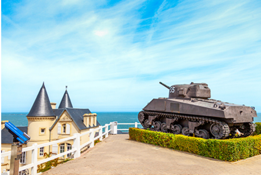
Arromanches - D-Day 10 €