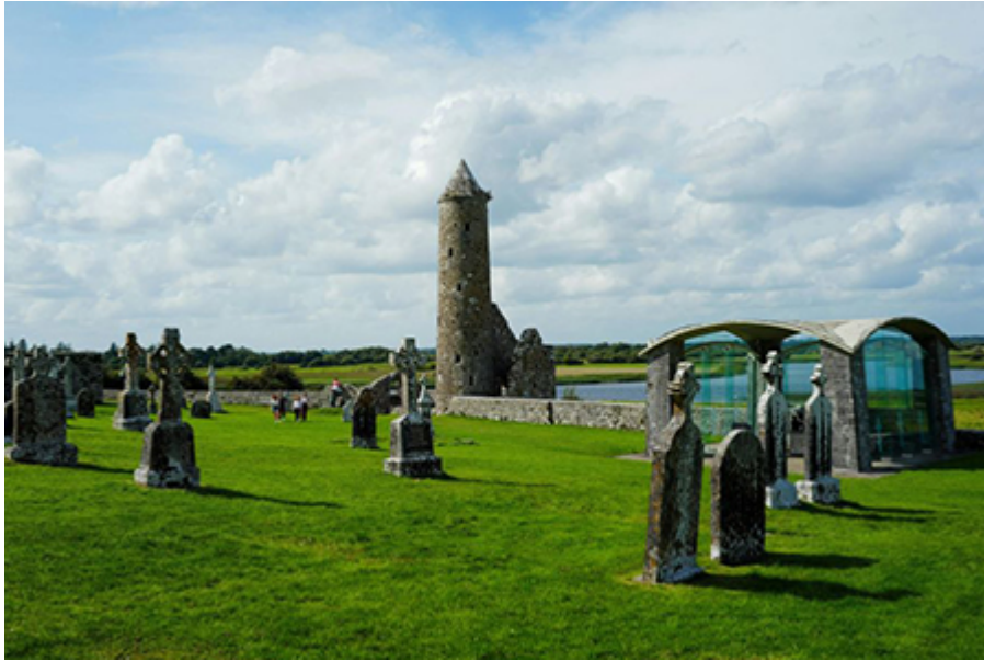
Clonmacnoise kolostor 6 €