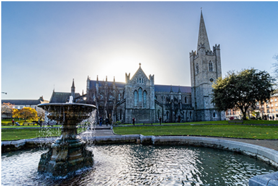
Szt. Patrik katedrális 11,5 €