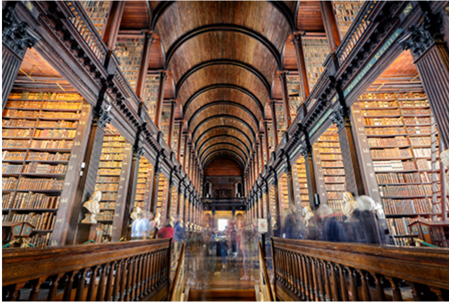
Dublin - Trinity College Könyvtár 26 €