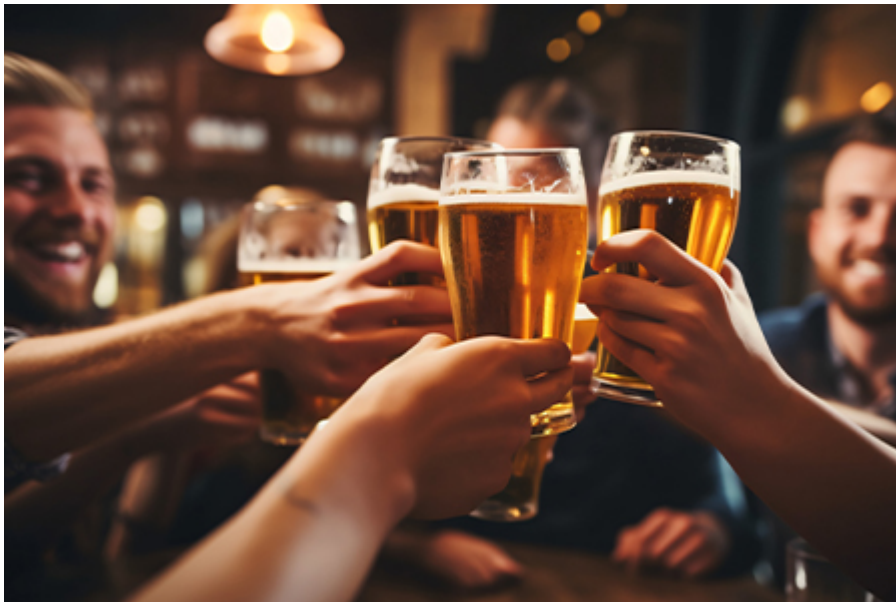
Dublin - Guinness Storehouse 32 €