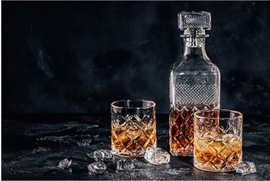
Dublin - Whiskey lepárló 26 €