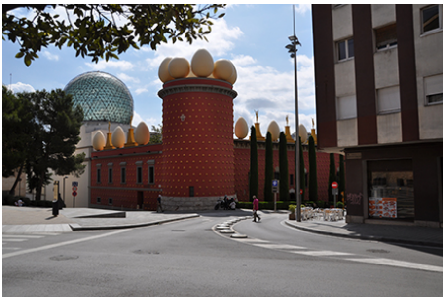
Figueras - Dalí Múzeum 14 €