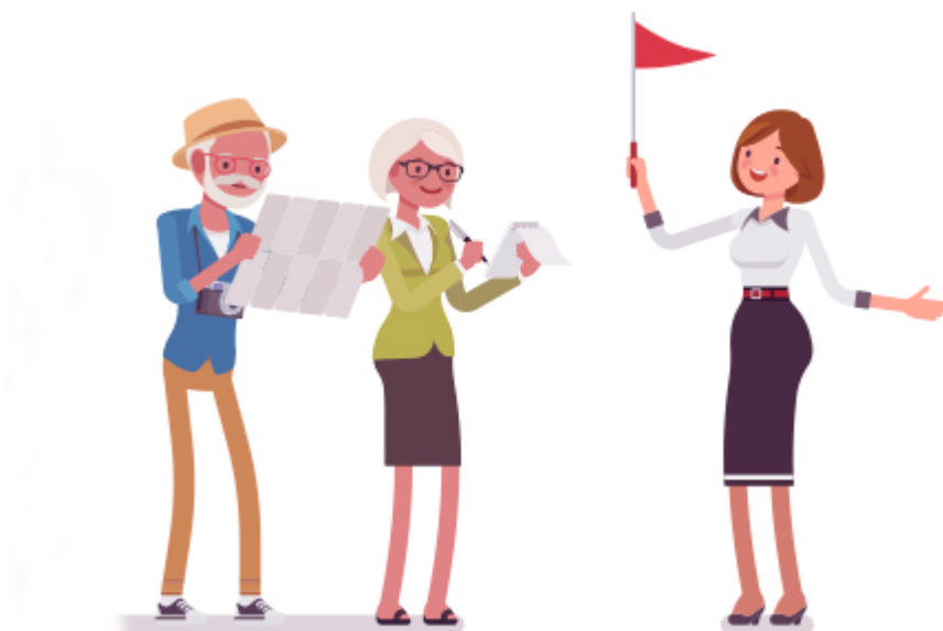
Zágráb - helyi idegenvezető 5 €