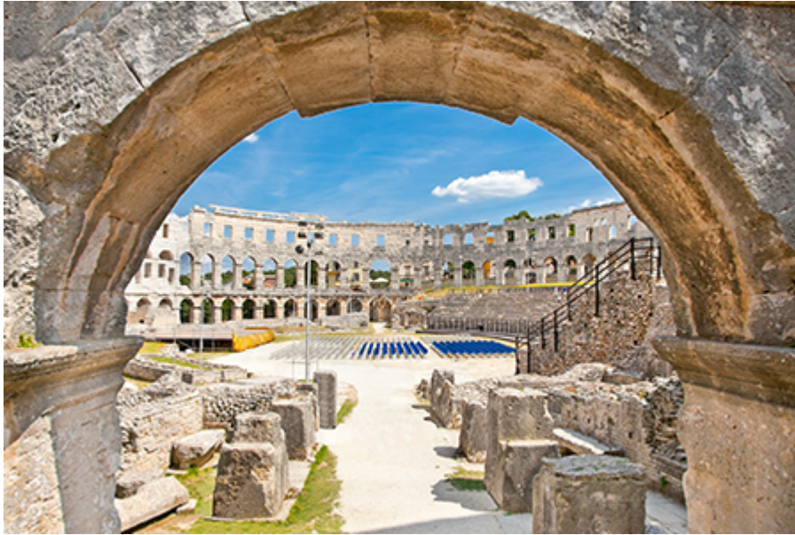
Pula – Aréna (Amfiteátrum) 14 €