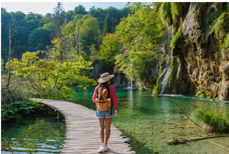
Plitvicei-tavak 35 €