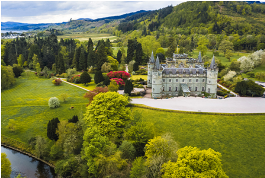
Inveraray kastély 19 font