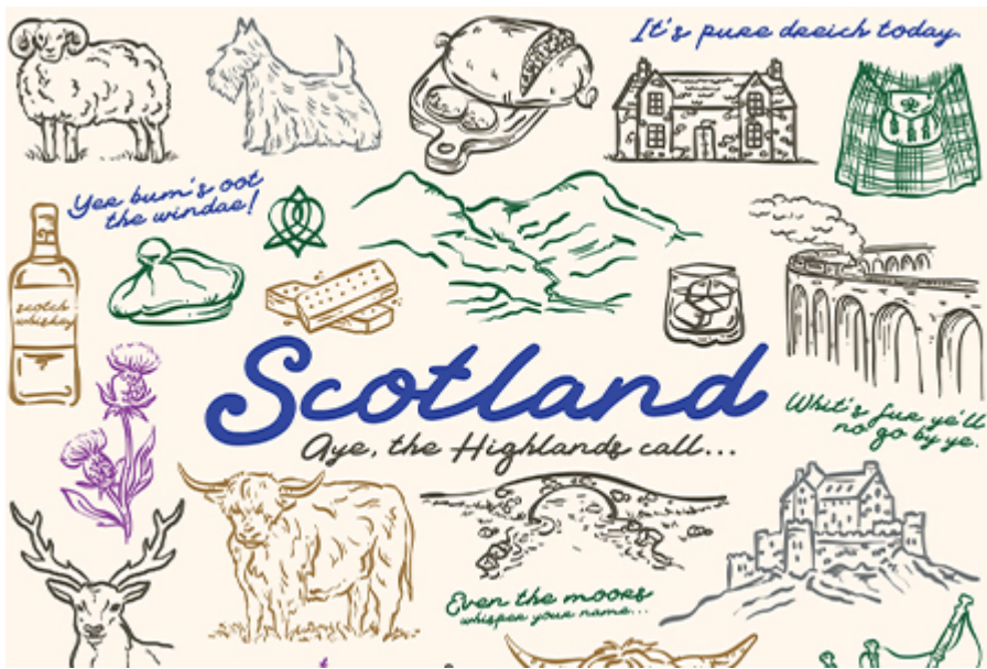
Historic Scotland Card - Explorer pass ( 5 nap) 50 font