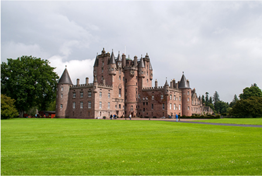
Glamis kastély 20 font