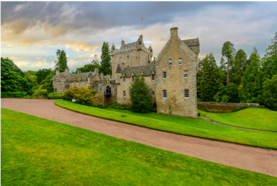
Cawdor Castle 17 font