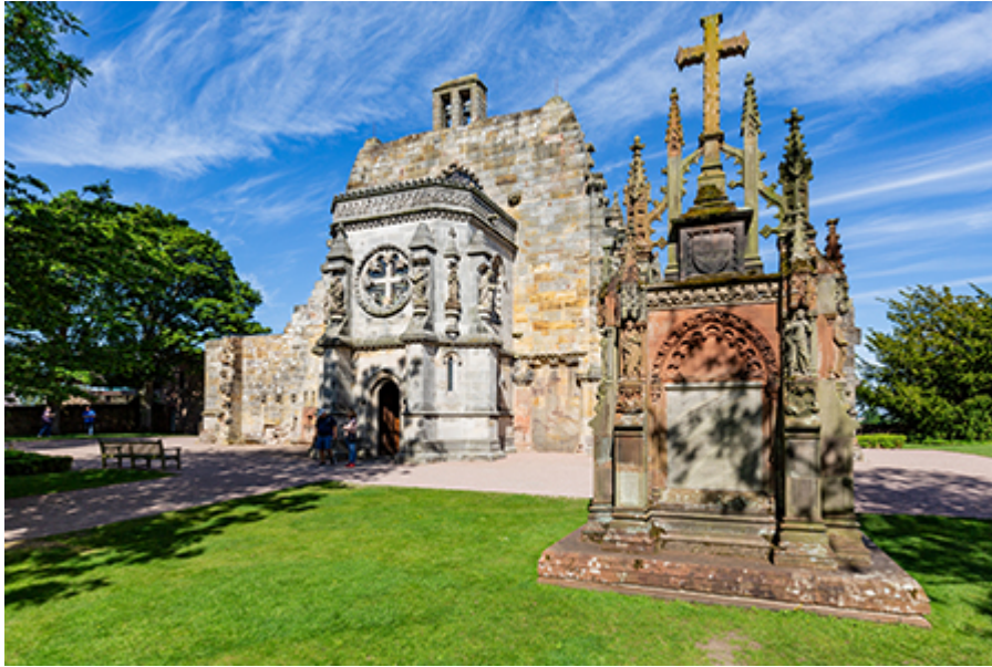
Rosslyn Kápolna 12 font