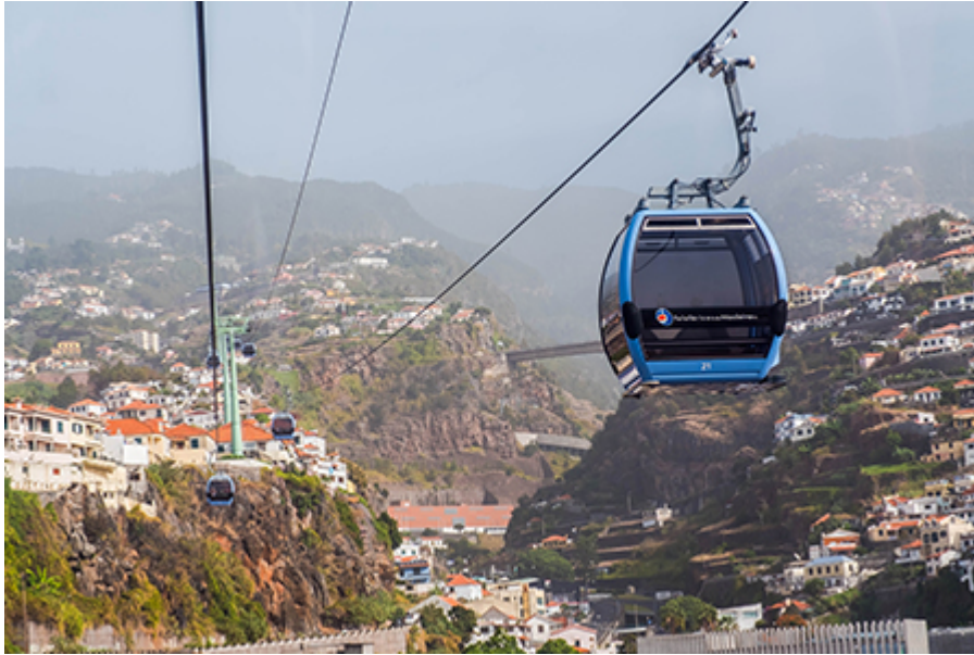
Monte felvonó (oda-vissza) 20 €