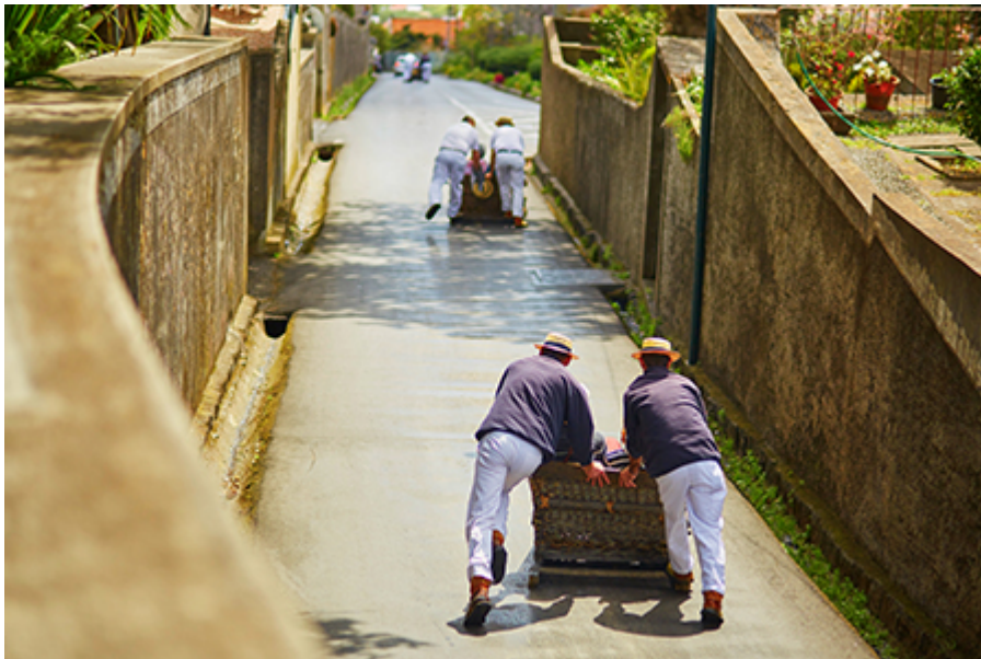
Monte Szánkó 27,5 €