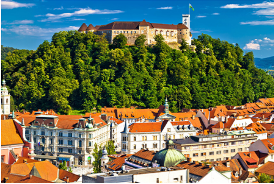
Ljubljana - Vár+Sikló 19 €