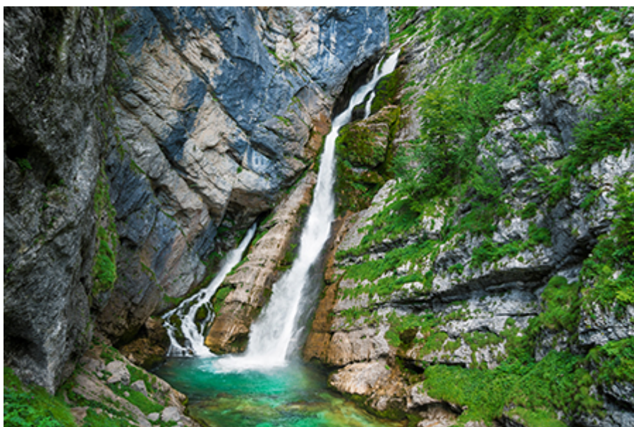
Savica vízesés 4 €