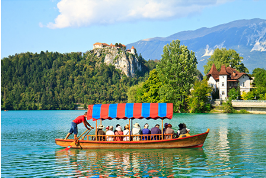
Bled - Pletna 20 €