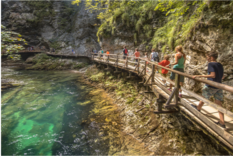
Vintgar-szurdok 15 €