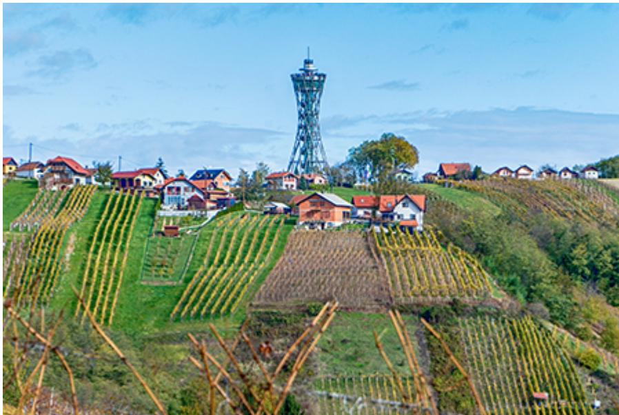
Lendva kilátó - Vinarium 7 €