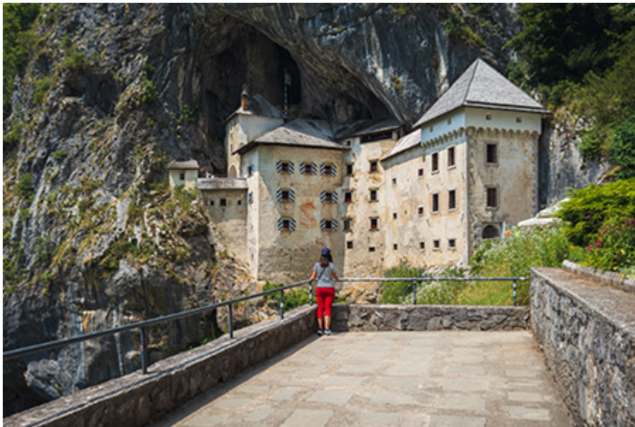
Postojna cseppkőbarlang + Predjama 49 €