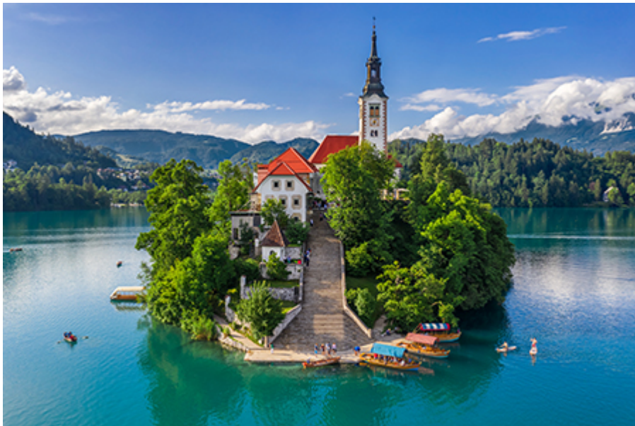
Bled - kápolna 12 €