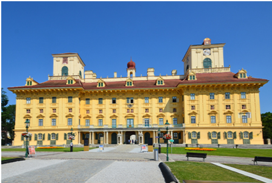
Kismarton - Eszterházy - kastély 21 €