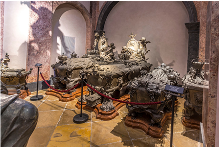
Bécs - Kapucínus altemplom 15 €