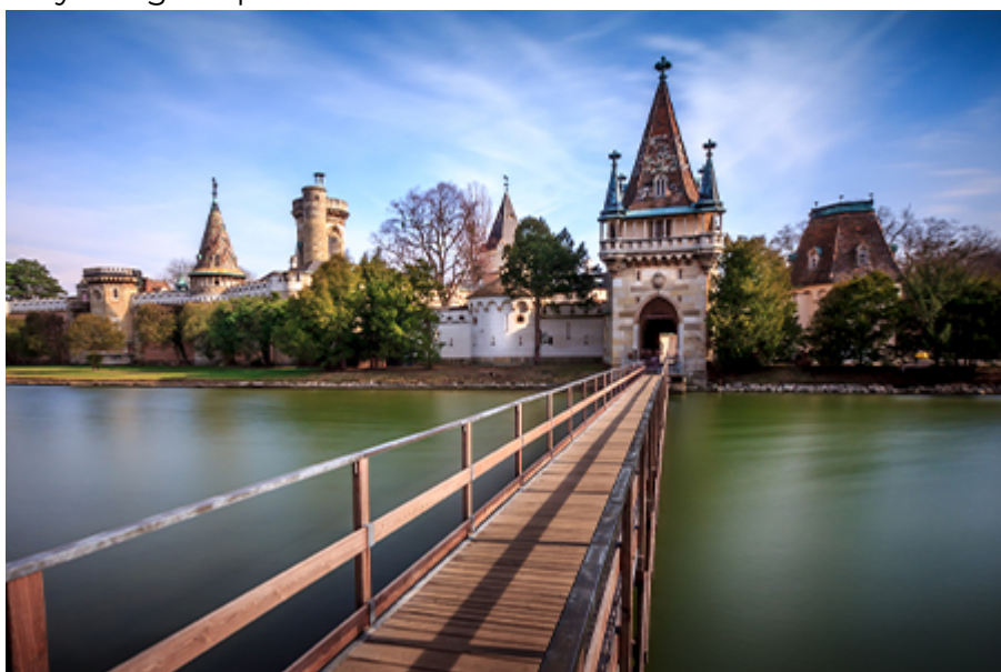
Laxenburg kastély 19 €