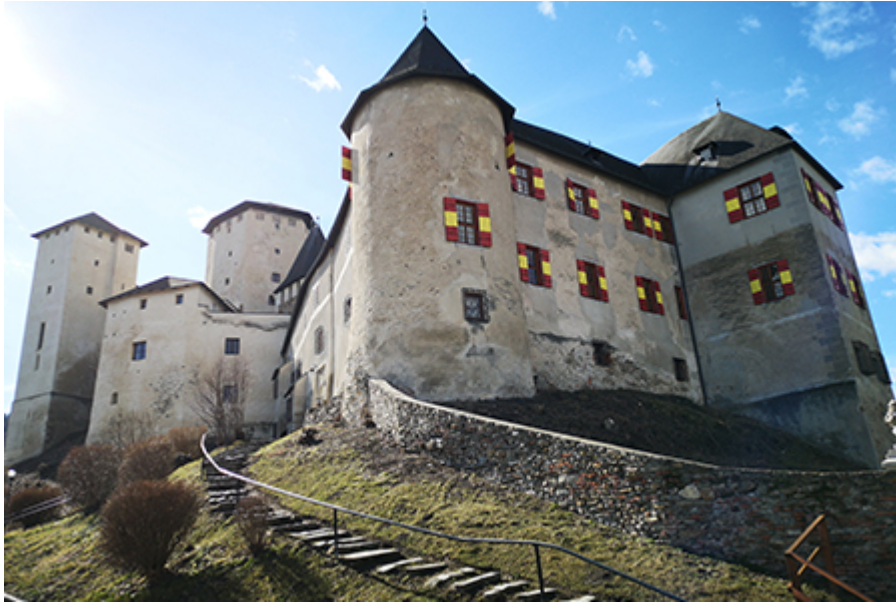
Léka vára 13 €