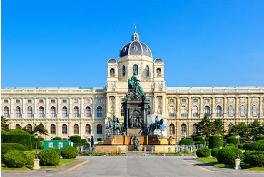
Bécs kincstár 18 €