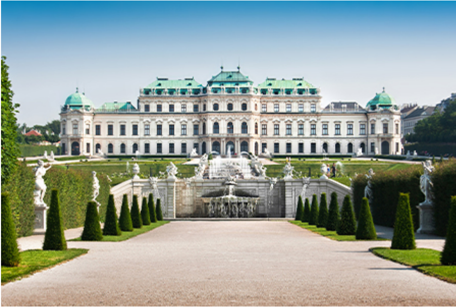
Bécs - Felső-Belvedere barokk kastély 21 €