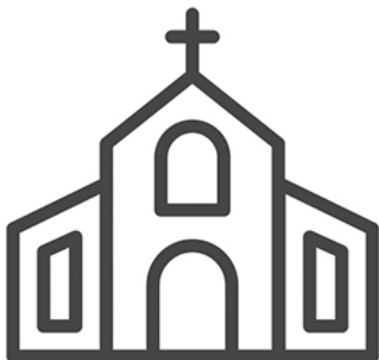
Mayerling - kápolna 9 €