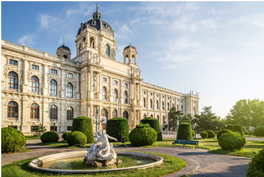
Művészettörténeti Múzeum 24 €