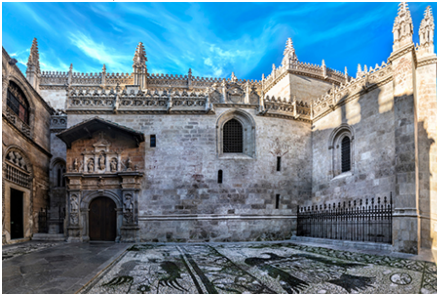
Granada - Katolikus Királyok kápolnája 7 €