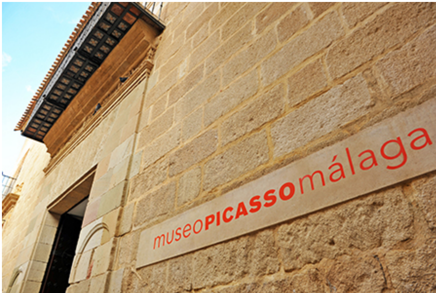
Malaga - Picasso Múzeum 13 €