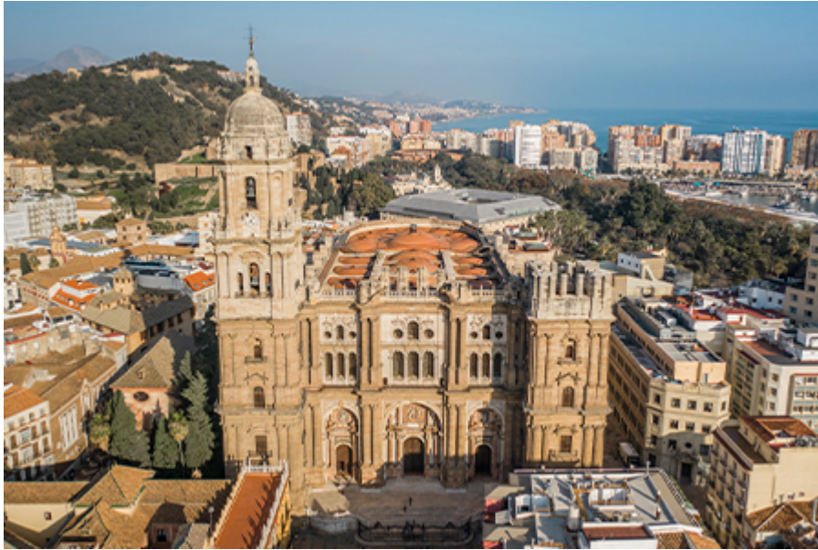
Malaga - Katedrális 10 €