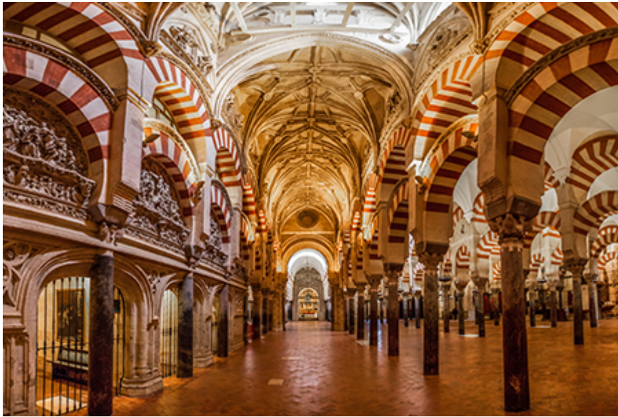
Cordoba - Mezquita 13 €