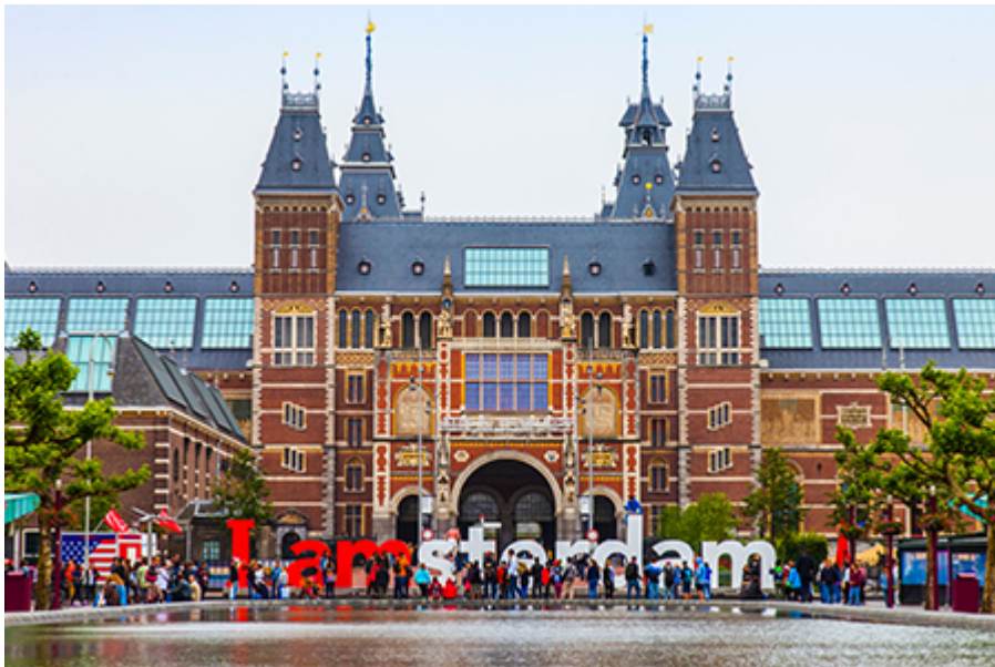
Amsterdam - Rijks Múzeum 25 €