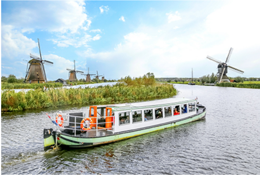
Kinderdijk hajózás (nyáron) 25 €